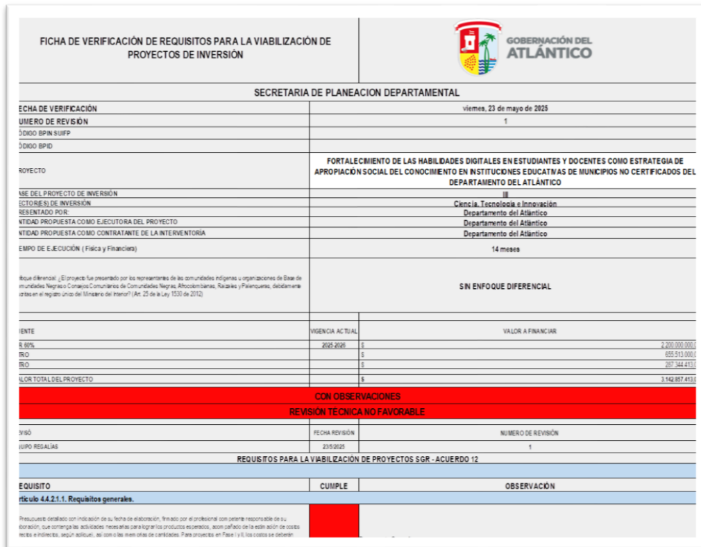
Anexo 3. Apoyo a la Secretaría de Educación en la revisión de los documentos soportes del proyecto “Fortalecimiento de las habilidades digitales en estudiantes y docentes como estrategia de apropiación social del conocimiento en instituciones educativas de municipios no certificados del departamento del Atlántico”