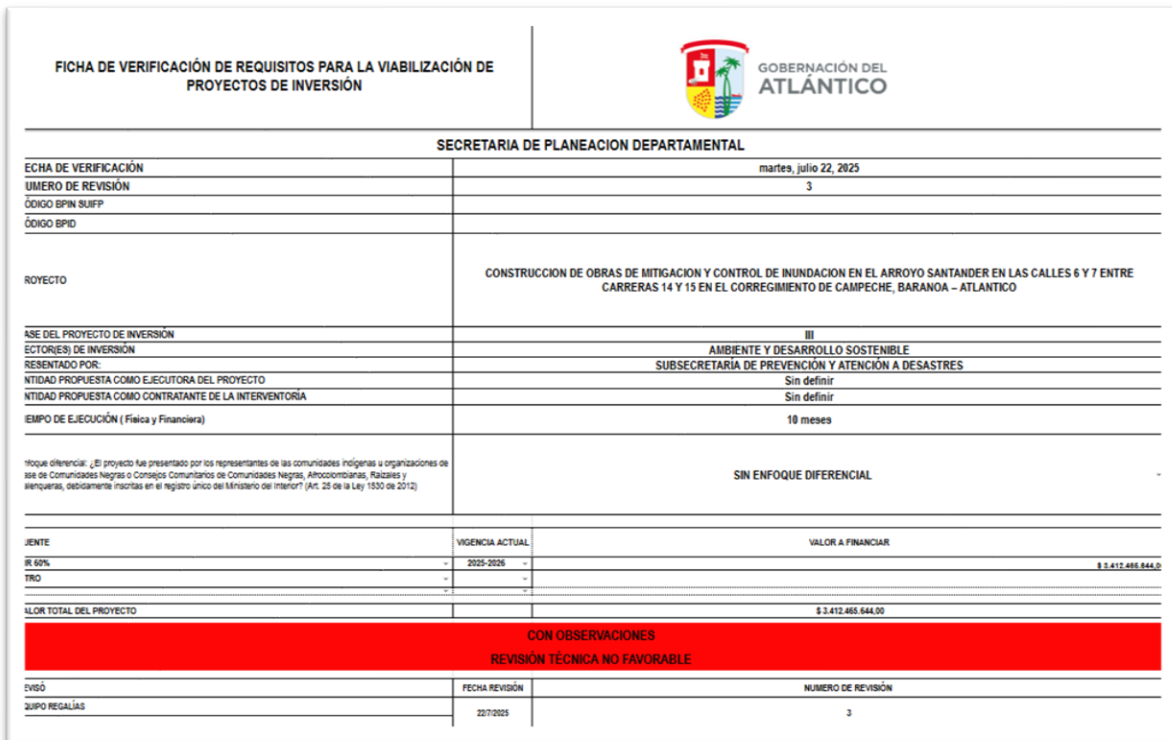
Anexo 5. Ficha 03 del proyecto “CONSTRUCCIÓN DE OBRAS DE MITIGACIÓN Y CONTROL DE INUNDACIÓN EN EL ARROYO SANTANDER EN LAS CALLES 6 Y 7 ENTRE CARRERAS 14 Y 15 EN EL CORREGIMIENTO DE CAMPECHE, BARANOA – ATLÁNTICO”