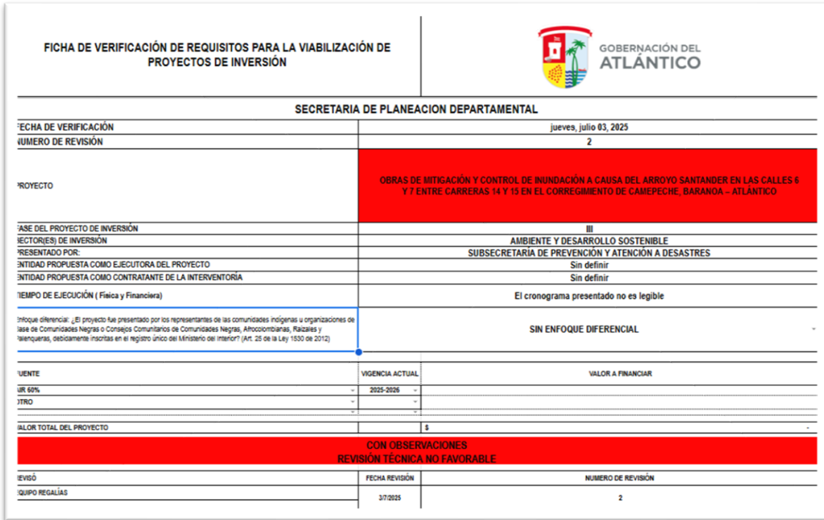
Anexo 4. Ficha 02 del proyecto “CONSTRUCCIÓN DE OBRAS DE MITIGACIÓN Y CONTROL DE INUNDACIÓN EN EL ARROYO SANTANDER EN LAS CALLES 6 Y 7 ENTRE CARRERAS 14 Y 15 EN EL CORREGIMIENTO DE CAMPECHE, BARANOA – ATLÁNTICO”