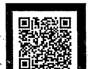
CARLOS ALBERTO CASTELLANOS GOMEZ Alcalde municipal