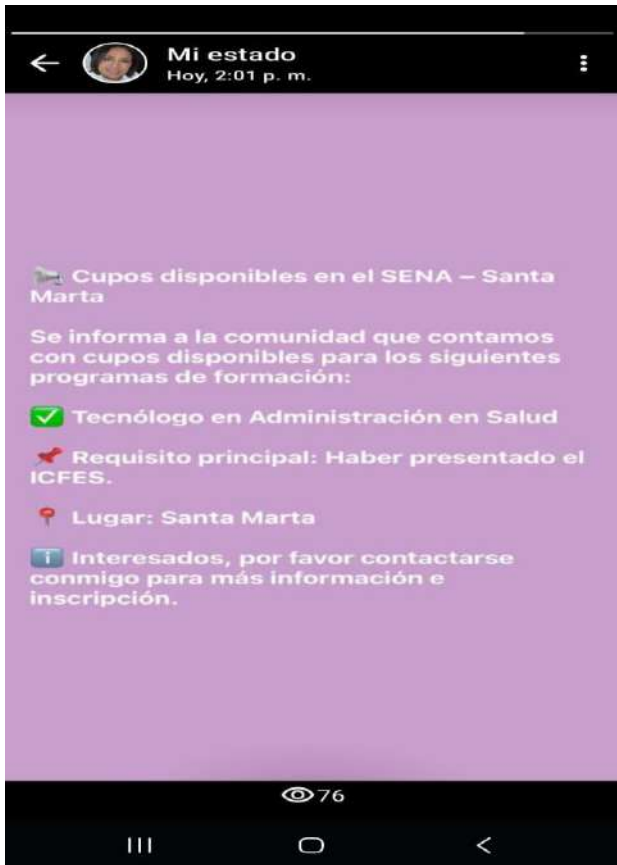
Anexo de evidencias No 7.