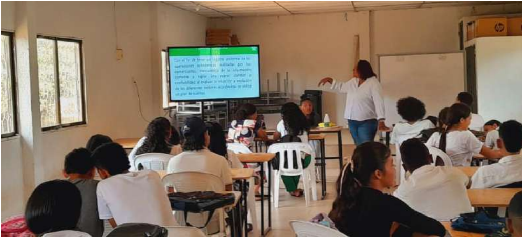
Anexo de evidencias No 1