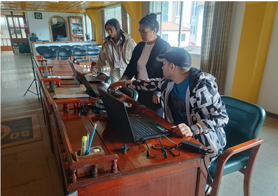
📷 Imagen 4 – Soporte en sitio (registro de intervención técnica)