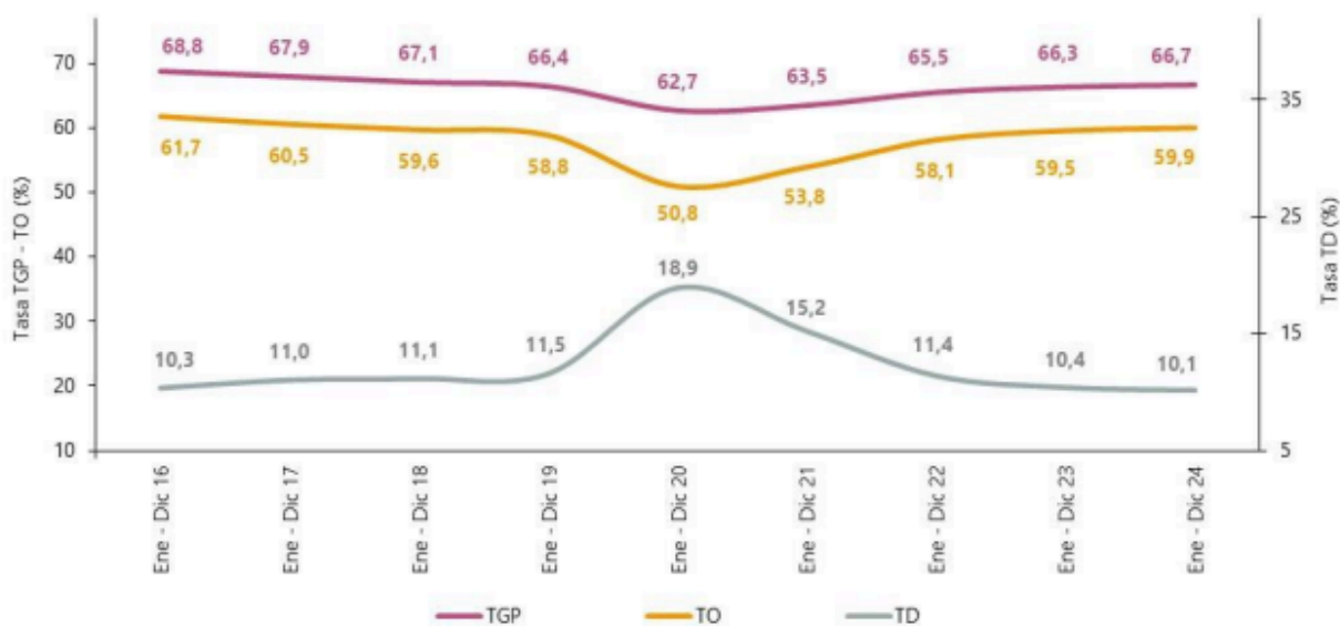
Gráfico No. 4 Tasa global de participación, ocupación y desocupación Total 13 ciudades y áreas metropolitanas Enero-diciembre (2016 - 2024)

En el 2024, la tasa de desocupación en el total de las 13 ciudades y áreas metropolitanas fue 10,1%, en el año 2023 fue 10,4%. La tasa global de participación se ubicó en 66,7%, lo que representó un aumento de 0,3 puntos porcentuales respecto al año de 2023 (66,3%). Finalmente, la tasa de ocupación fue 59,9%, lo que representó un aumento de 0,5 puntos porcentuales respecto al año de 2023 (59,5%).