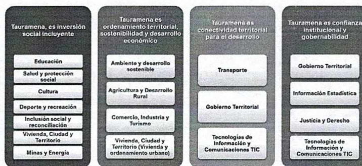
Ilustración 2 Estructura Plan de Desarrollo 2024-2027

Fuente: Plan de Desarrollo Territorial 2024 - 2027