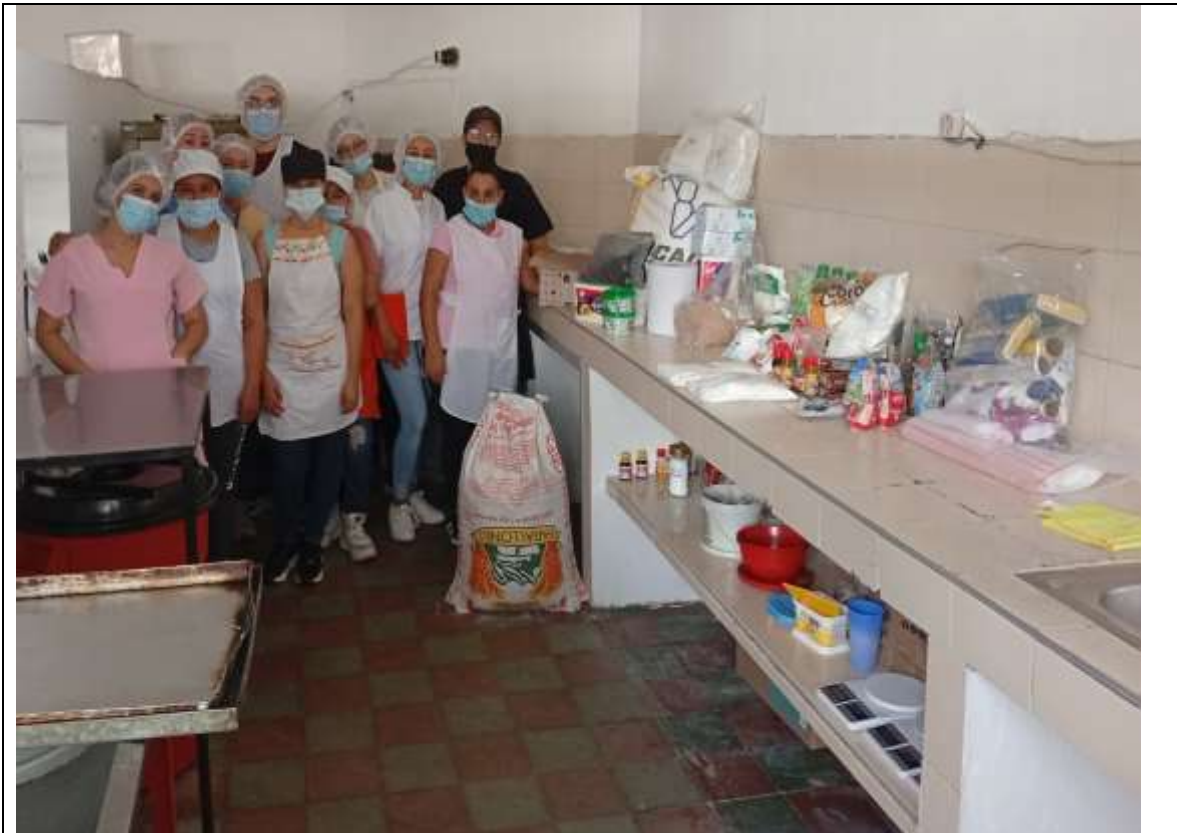
ELABORACION DE PANES TIPO ARTELLANO