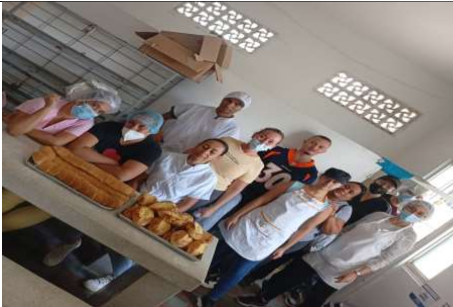
GRUPO 1 DE PRACTICA AUTONOMA