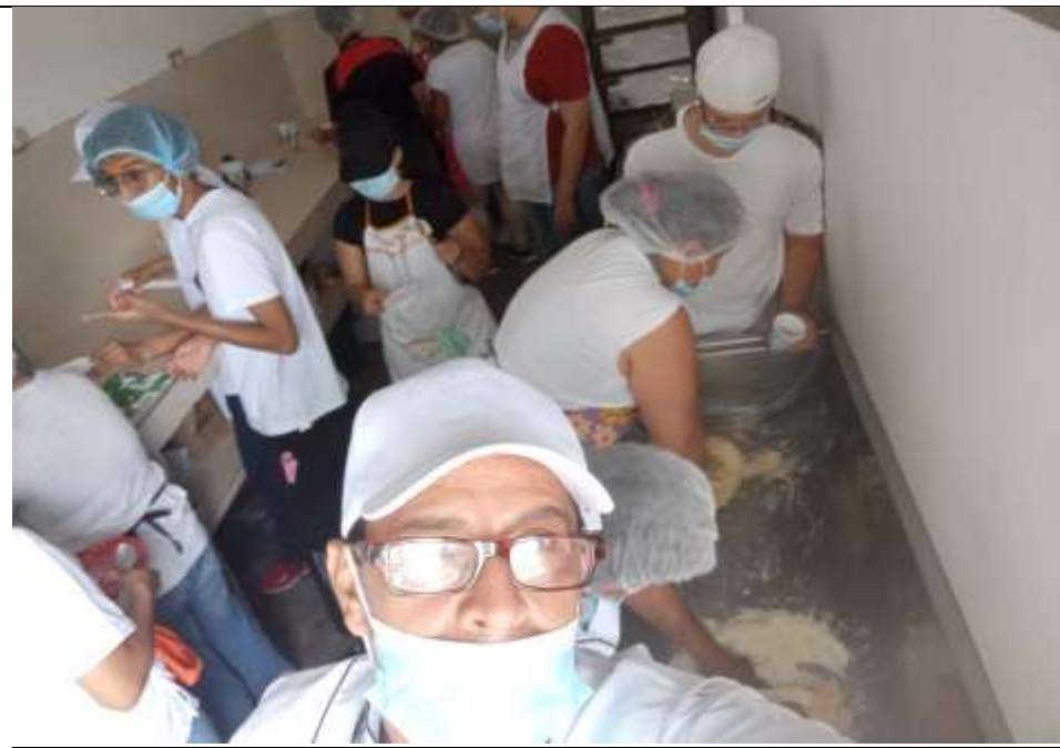
MEDICIONES EN ARTESA CONCAVA