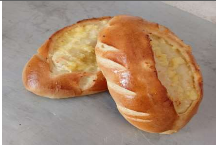
PRODUCTO TERMINADO PAN ALIÑADO; ARMADO EN DOBLE ROLLO