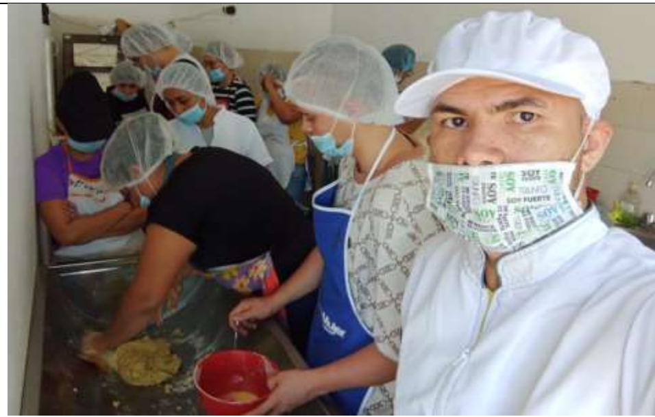
PROCESO DE ELABORACION MOJE BLANDO