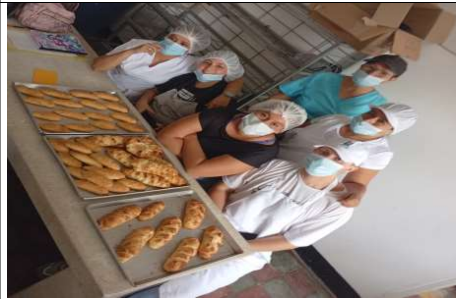
PRESENTACION DE PRODUCTO