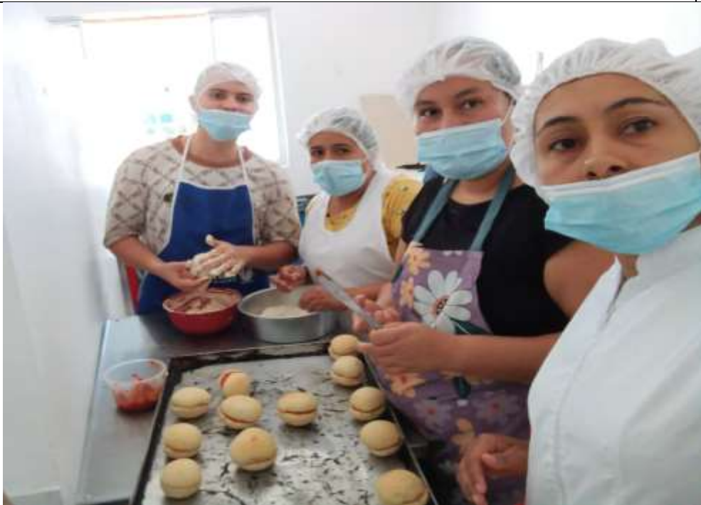
GRUPO 2 BATIDO PARA PERAS O YOYOS