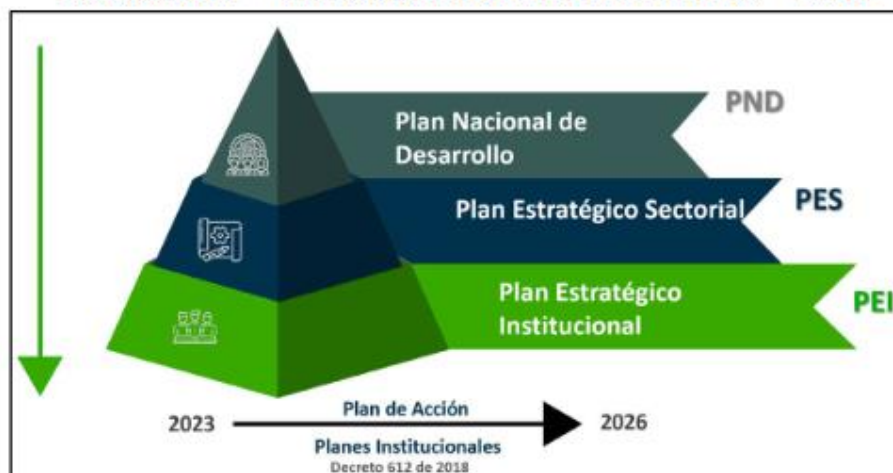
Ilustración 2 Alineación normativa PEI 2023 – 2026

Del mismo modo, el artículo número cuatro de la Ley 119 de 1994, consagra las funciones del SENA, tales como: