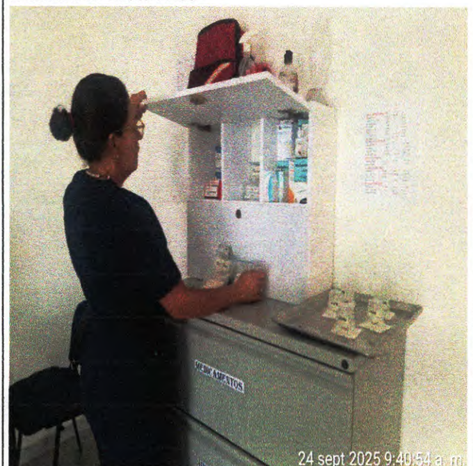
Control de almacen y desinfeccion.