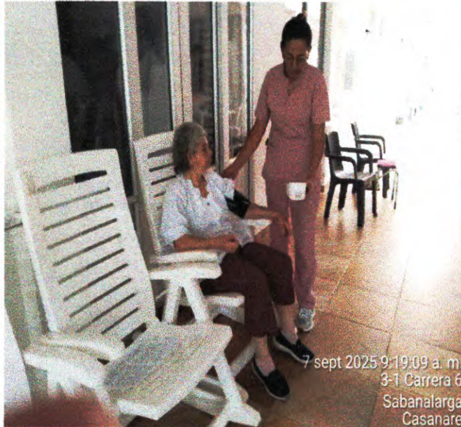
Control de signos.