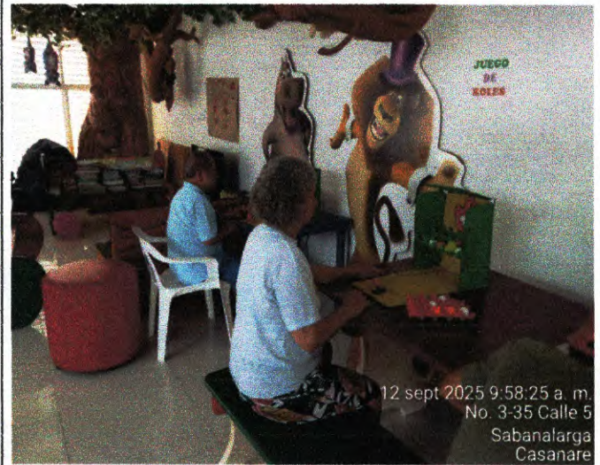
actividad N°7 foto N°14

12 sept 2025 9:58:25 a. m. No. 3-35 Calle 5 Sabanalarga Casanare