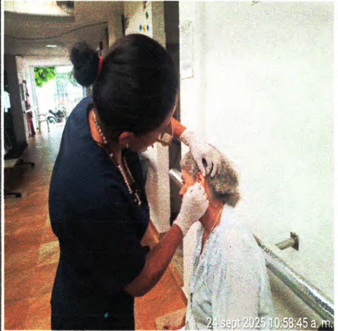
actividad N°5 foto N°10