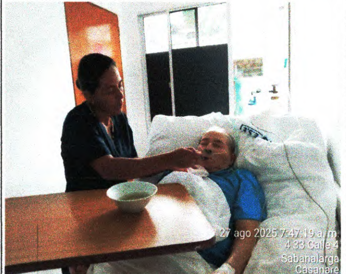
actividad N°8 foto N°16

27 ago 2025 7:47:19 a. m. 4 33 Calle 4 Sabanalarga Casanare