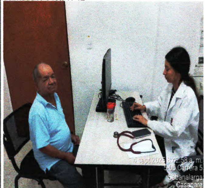
actividad N°6 foto N°12

4 sept 2025 8:42:58 a. m. 5-05 Carrera 5 Sabanalarga Casanare