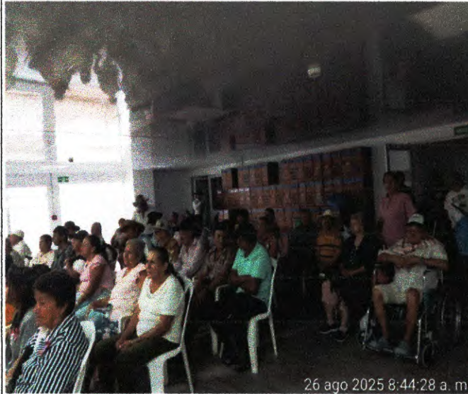
actividad N°7 foto N°13