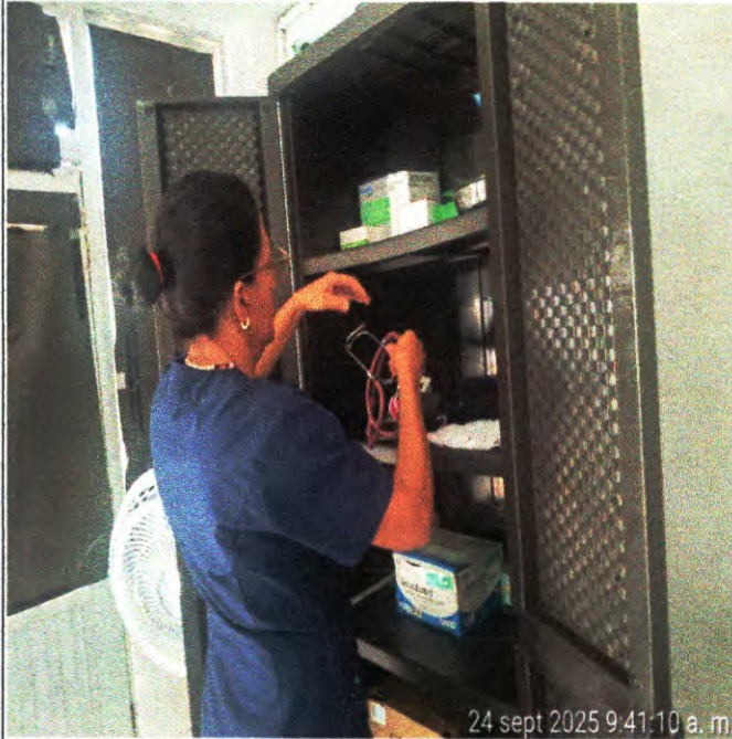
Control de almacen y desinfeccion.