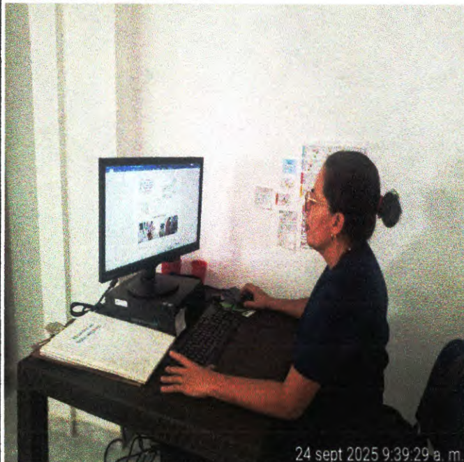
Notas de enfermería en sistema.