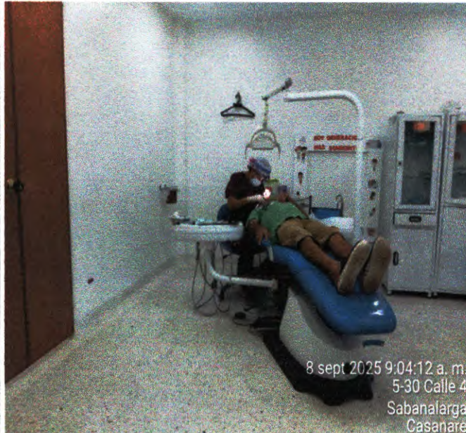
actividad N°6 foto N°11

8 sept 2025 9:04:12 a. m. 5-30 Calle 4 Sabanalarga Casanare