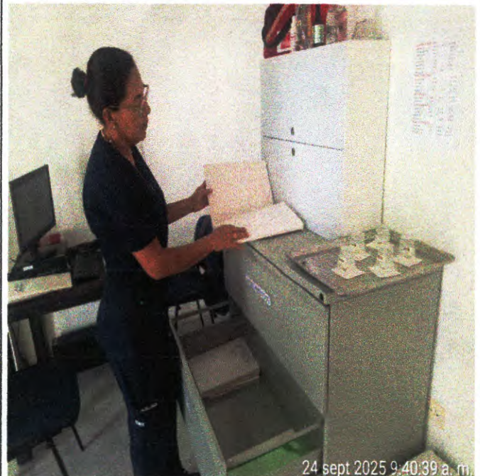
Revisando Laboratorios en historias Clínicas