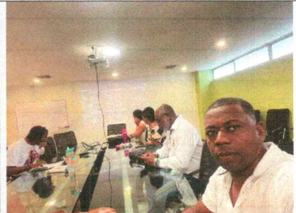
Foto:5 Se realizo y definieron lineamientos y acciones conjuntas entre la secretaria de educación y las instituciones educativas con el fin de mejorar la calidad educativa.

Foto: 4 Recorrido de campo con los estudiantes de la Institución Educativa Liceo del pacifico conociendo la huerta ecológica para realizar el diagnostico.