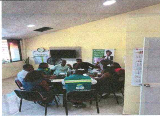
Foto 2 Mesa de diálogo y concertación con entidades, generando estrategia para mejorar el reciclaje en el Distrito Especial de Buenaventura.

Foto1. Reunión con docentes, funcionario del EPA y la Secretaria de Etnoeducación en la institución liceo del pacifico, generando estrategias para el manejo de los proyectos PRAES de las Instituciones.