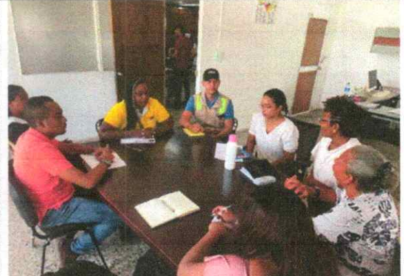
Foto:3 Mesa de planeación interinstitucional para el fortalecimiento de la educación ambiental. Coordinar acciones conjuntas entre las entidades que integran el CIDEA.

Foto 2 Mesa de diálogo y concertación con entidades, generando estrategia para mejorar el reciclaje en el Distrito Especial de Buenaventura.