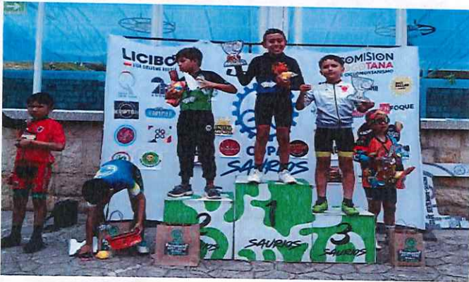
Anexo actividad 3.