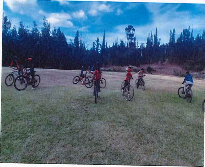
Anexo actividad 1