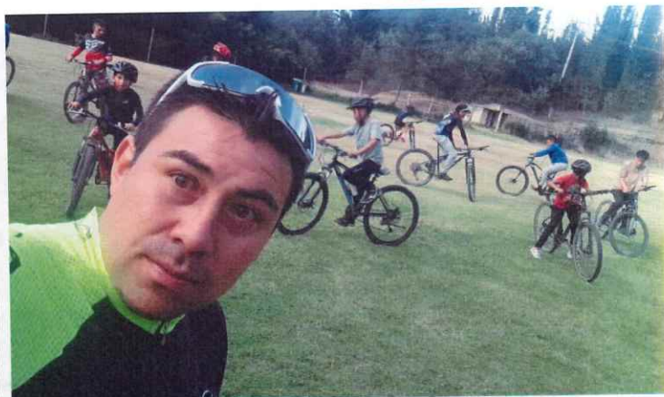
Anexo actividad 10