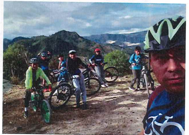
Anexo actividad 8