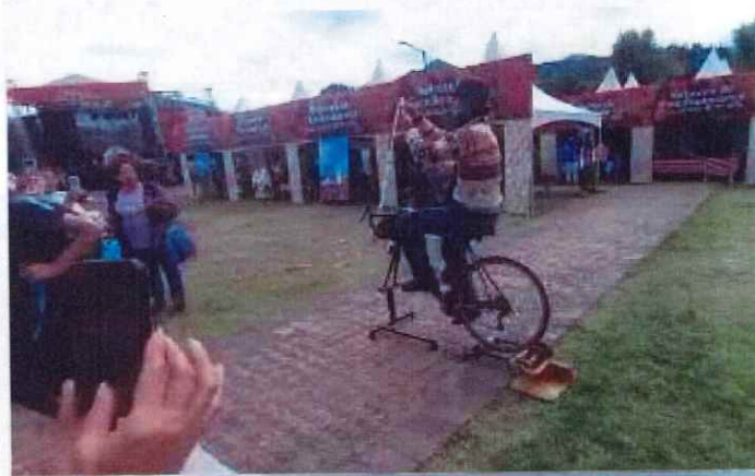
Anexo actividad 13