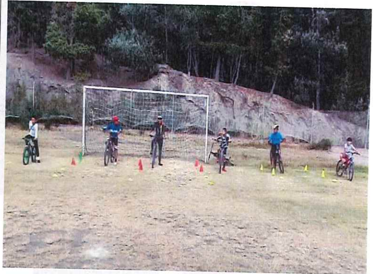
Anexo actividad 2