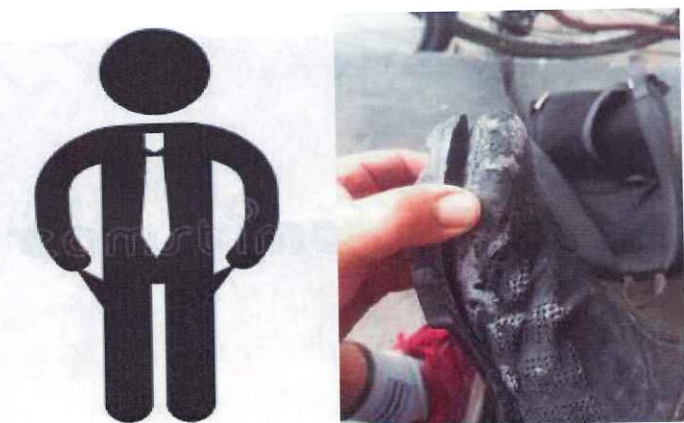
Anexo actividad 9