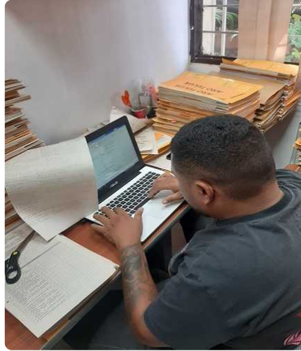
Elaboración y actualización de los inventarios físicos y digitales del Aro Cartago, correspondientes al año 2024