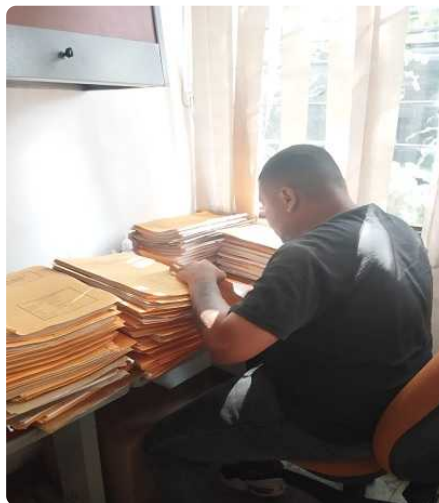
Revisión de las carpetas de Aro Sur Cali, con el fin de identificar documentos faltantes y realizar su correspondiente archivo