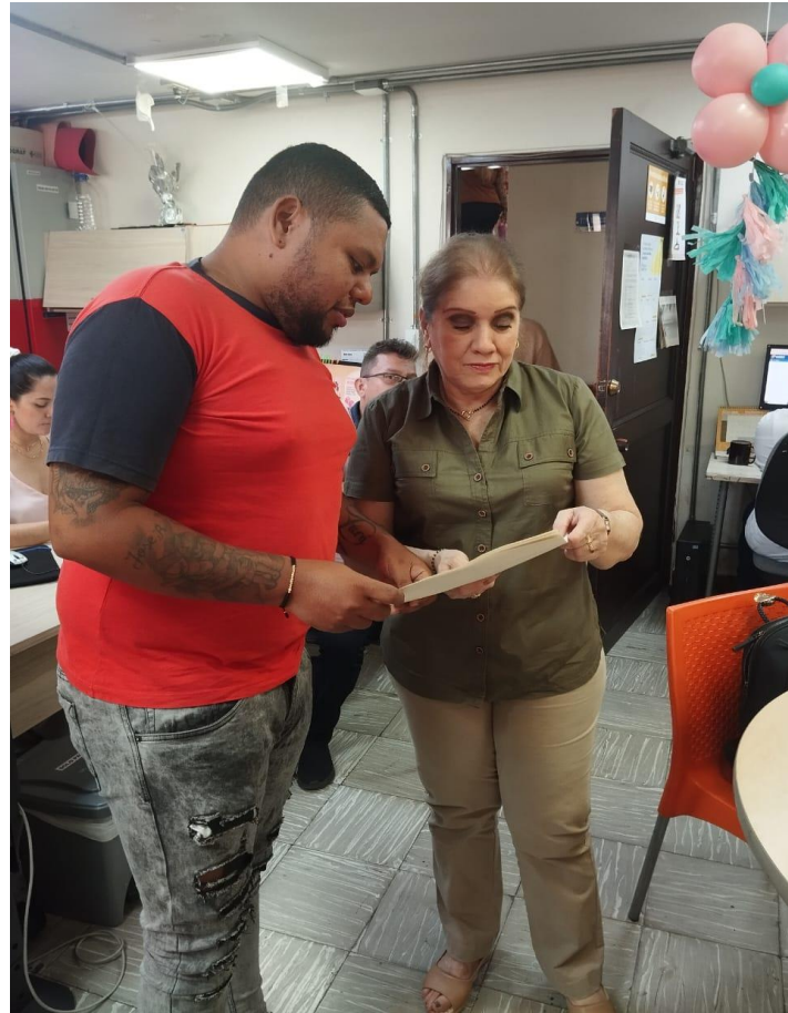
Anexo No 1: Recibir documentación Aro Sur Cali