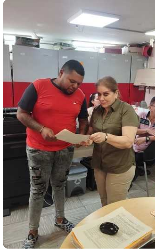
Recibir documentación Aro Sur Cali

jsbrinez- IP : 161.18.14.126. Fecha : 2025-10-01 17:29:16