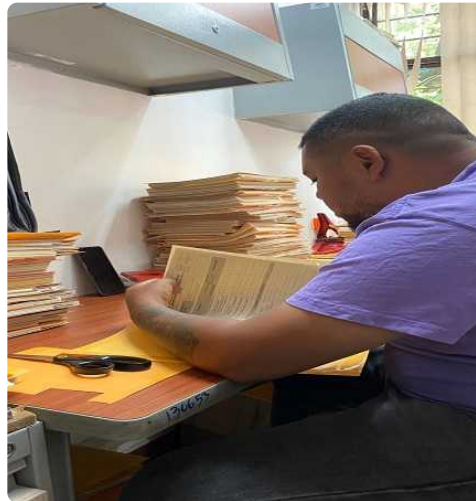
Clasificación, organización, expurgo, foliación, numeración, rotulación y archivo de los documentos correspondientes al año 2024.