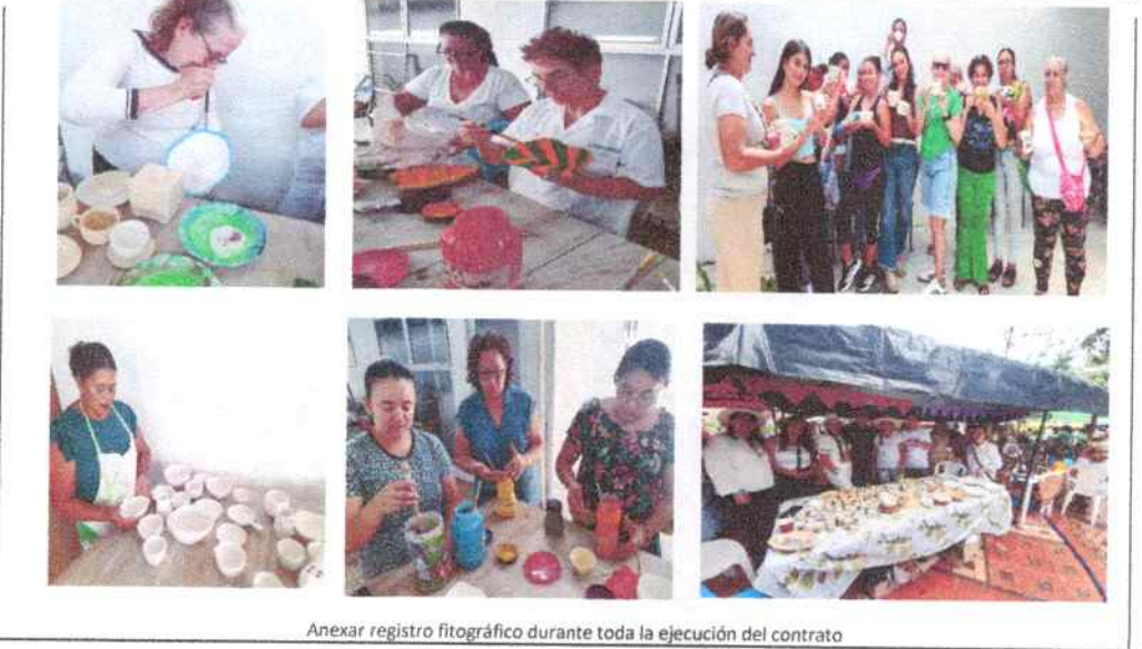
Anexar registro fotográfico durante toda la ejecución del contrato

Certificar el cumplimiento de la seguridad social y parafiscales durante el mes de septiembre de 2025 (incluido en un folio)