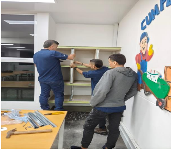
Registro fotografico formacion

Evidencia N. 2 – Registro fotográfico formación aprendices ficha N. 3015032 técnico en construcción de edificaciones.