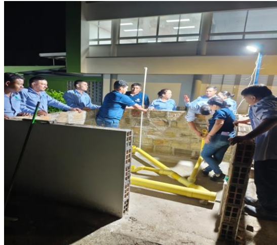
Registro fotografico formacion