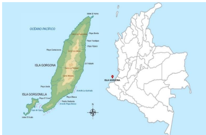
Localización Parque Nacional Natural Gorgona.

desde este punto hasta las 02°56´00"N, 78°06´00"W, cerrándose en un rectángulo, cortado en su vértice sur oriental, entre las coordenadas norte y sur.