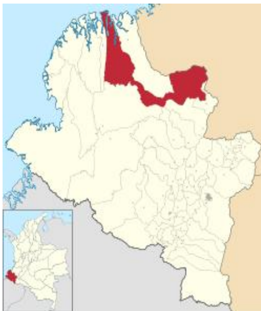
Localización vereda Bazán, zona Bajo Tapaje, municipio El Charco, Nariño.