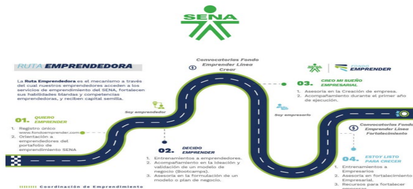
Tomado de: Lineamientos para la operación de los proyectos y programas de la Coordinación Nacional de Emprendimiento vigencia