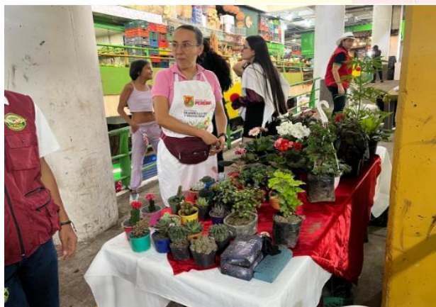
Pereira de Cosecha en la Plaza de Mercado Impala.

ACTIVIDAD: Pereira de cosecha en la plaza