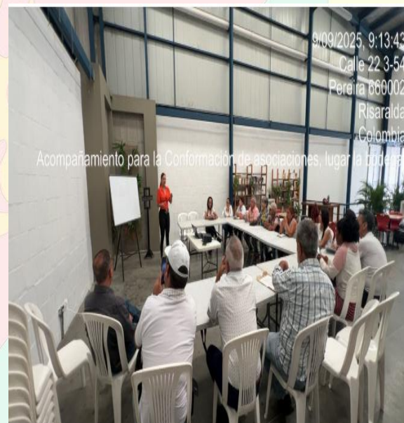
Capacitación en asociatividad Bodega KM 0