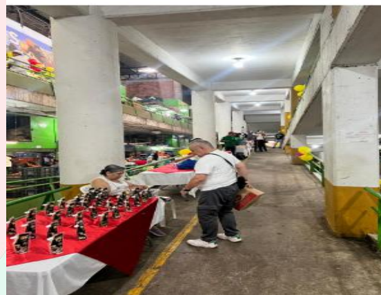
Pereira de cosecha en la plaza de mercados Impala,