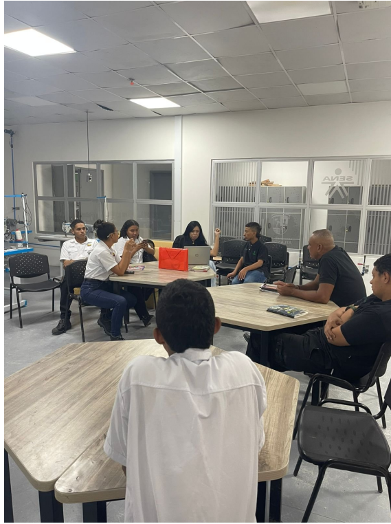
Ilustración 3: Consejería y orientación Grupal, Nodo de diseño y mobiliario, Galapa, Octubre 2025.