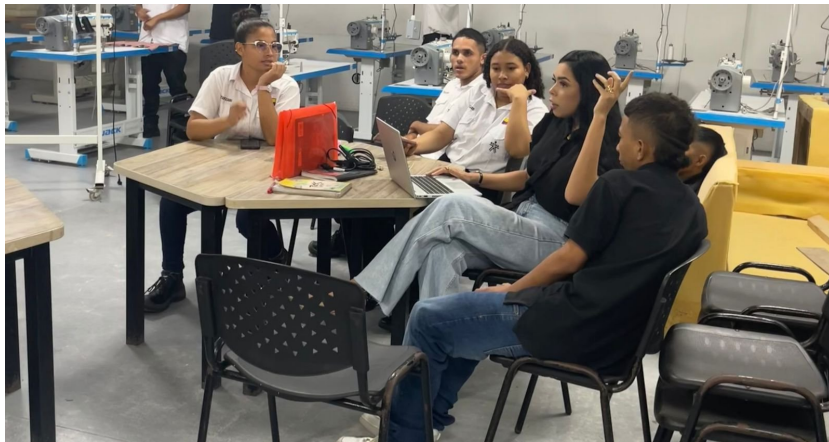
Ilustración 4: Consejería y orientación Grupal, Nodo de diseño y mobiliario, Galapa, Octubre 2025.