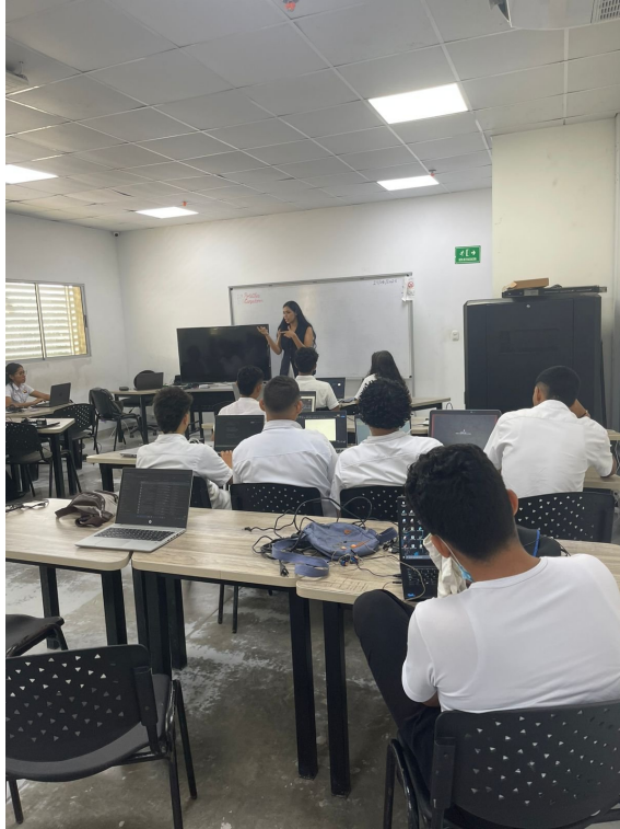
Ilustración 1: Valor del Mes, Nodo de diseño y mobiliario, Galapa, Octubre 2025.