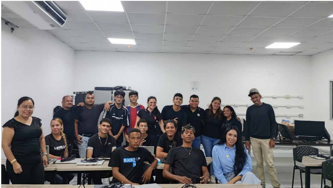
Ilustración 8: Valor del Mes Nocturna, Nodo de diseño y mobiliario, Galapa, Octubre 2025.