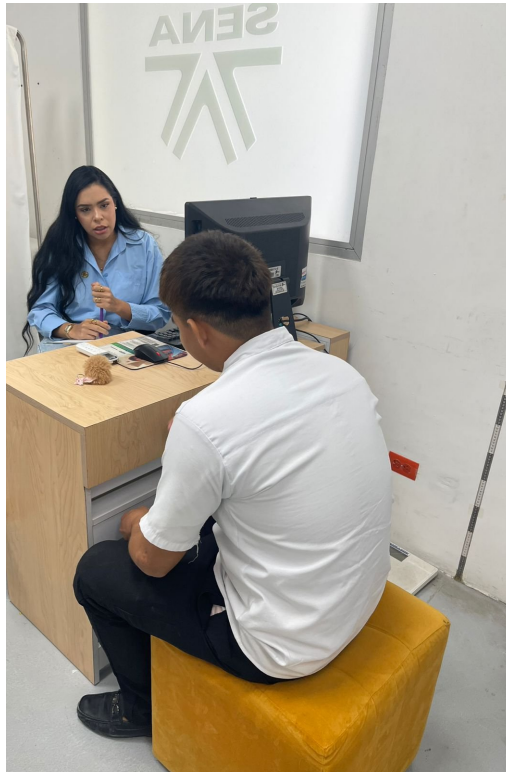
Ilustración 5- 6: Consejería y orientación Individual, Nodo de diseño y mobiliario, Galapa, Octubre 2025.