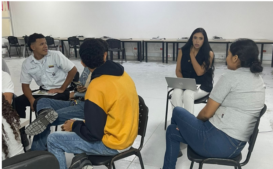
Ilustración 2: Consejería y orientación Grupal, Nodo de diseño y mobiliario, Galapa, Octubre 2025