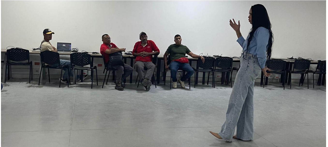
Ilustración 7: Consejería y orientación Grupal Nocturna, Nodo de diseño y mobiliario, Galapa, Octubre 2025.