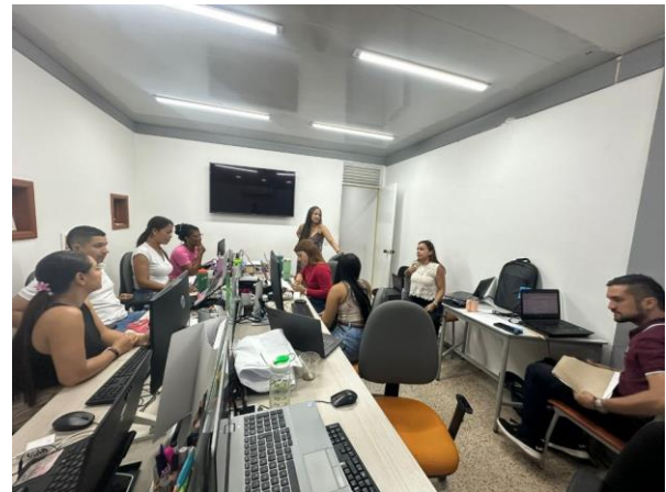
8-10-2025 Reunion de equipo