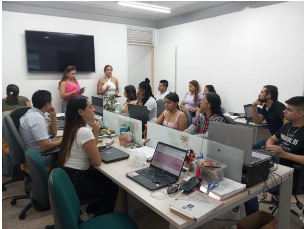
30-09-2025 Reunion de equipo