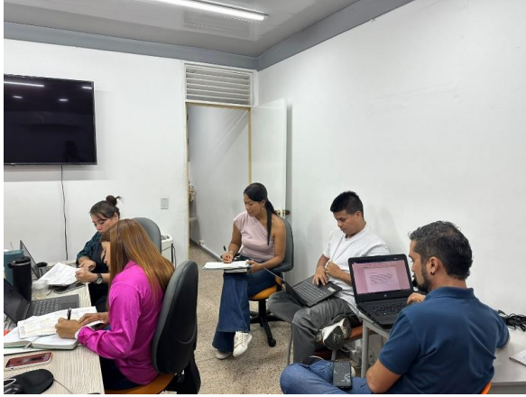
22-09-2025 reunion de equipo