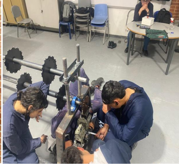
VISITA AL CENTRO METALMECANICO