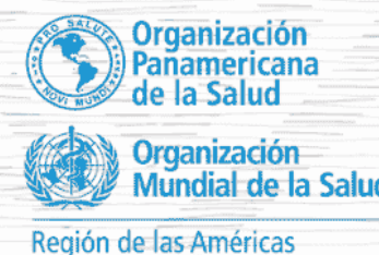
Dr. Jarbas Barbosa da Silva Jr. Director