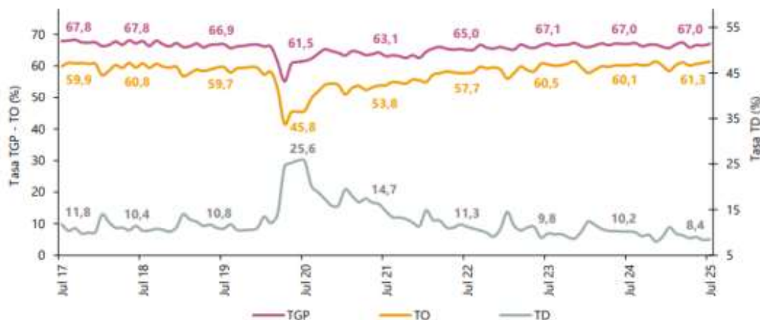
Gráfico 3. Tasa global de participación (TGP), Tasa de ocupación (TO) y Tasa de desocupación (TD) Total 13 ciudades y áreas metropolitanas Julio (2017 - 2025).