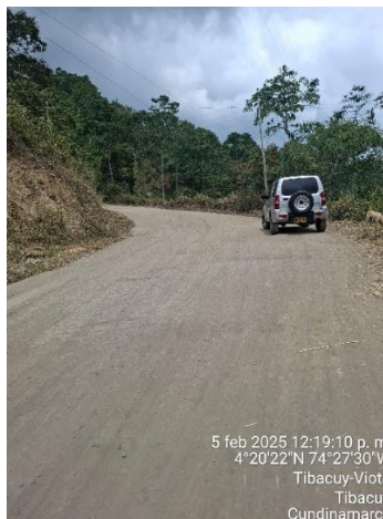
Fotografía 2 tramo con estructura envejecida, se desconoce el tipo de intervención y su longevidad.

El estado actual de la vía genera un nivel de servicio bajo, lo cual se refleja en bajas velocidades de recorrido aumentando el tiempo de viaje, costos de operación, mantenimiento vial y de vehículos.