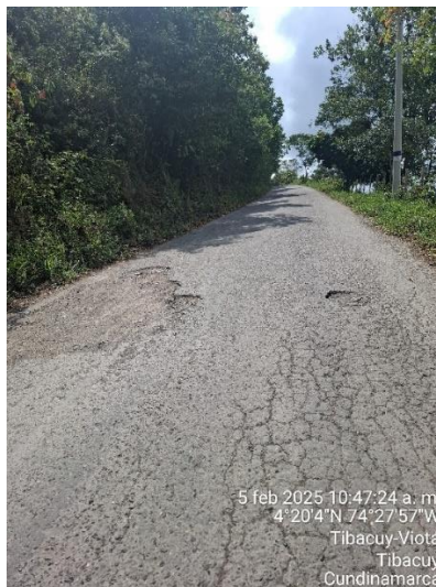
Fotografía 1 Estado actual de la subrasante.

La vía a intervenir conecta la inspección de Cumaca con el municipio de Tibacuy, se han priorizado tramos en adoquín y otros en carpeta asfáltica, cuyo alcance total abarca 3.800 m, el corredor vial está conformado por una calzada de un ancho de vía promedio de 6 metros, con subrasante a la vista, conformada por aparentes materiales de la zona, visibles zonas de expansión contracción y patologías producto de la infiltración hídrica y la deficiente escorrentía producto de la inexistencia de estructuras de drenaje. En las fotografías se relacionan las condiciones de la subrasante existente que se evidenció durante el recorrido efectuado.