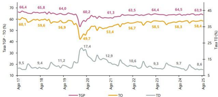
Gráfico 2. Tasa global de participación (TGP), Tasa de ocupación (TO) y Tasa de desocupación (TD) Total nacional Agosto (2017 - 2025)

Para el mes de agosto de 2025, la tasa de desocupación del total nacional fue 8,6%, lo que representó una disminución de 1,1 puntos porcentuales respecto al mismo mes del año anterior (9,7%). La tasa global de participación se ubicó en 63,9% y la tasa de ocupación en 58,4%, mientras que en agosto de 2024 fueron 64,5% y 58,3%, respectivamente.