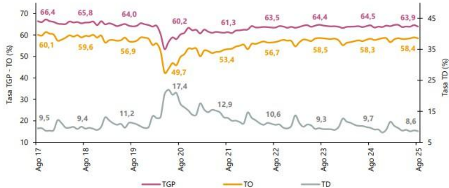
Gráfico 1. Tasa global de participación (TGP), Tasa de ocupación (TO) y Tasa de desocupación (TD) Total nacional Agosto (2017 - 2025)