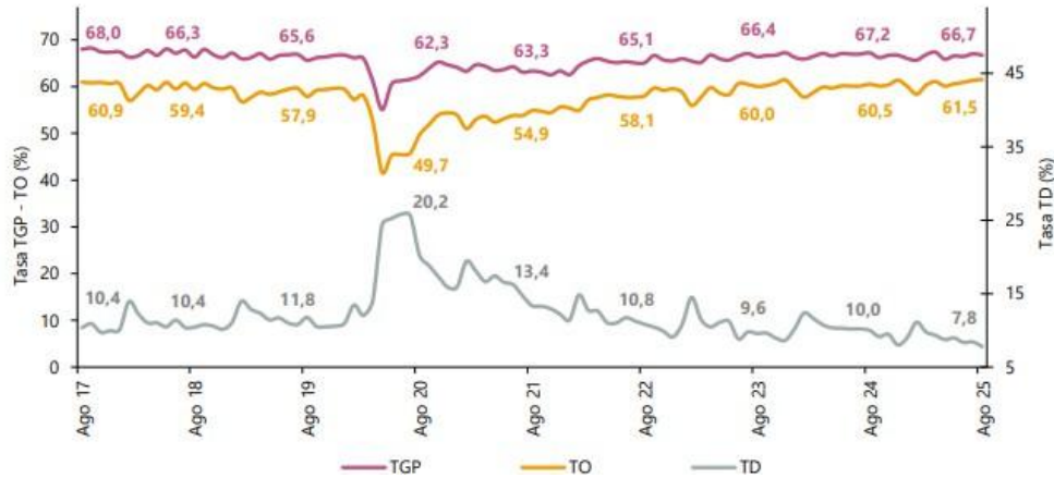
Gráfico 3. Tasa global de participación (TGP), Tasa de ocupación (TO) y Tasa de desocupación (TD) Total 13 ciudades y áreas metropolitanas Agosto (2017 - 2025)

año anterior (10,0%). La tasa global de participación se ubicó en 66,7% y la tasa de ocupación en 61,5%, mientras que en agosto de 2024 fueron 67,2% y 60,5%, respectivamente.