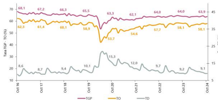
Gráfico 2. Tasa global de participación (TGP), Tasa de ocupación (TO) y Tasa de desocupación (TD) Total nacional Octubre (2016 - 2024)

1.1.1. Total nacional mensual Para el mes de octubre de 2024, la tasa de desocupación del total nacional fue 9,1%, mientras que en octubre de 2023 fue 9,2%. La tasa global de participación se ubicó en 63,9% y la tasa de ocupación en 58,1%, en el mismo mes del año anterior estas tasas fueron 64,0% y 58,1%, respectivamente.