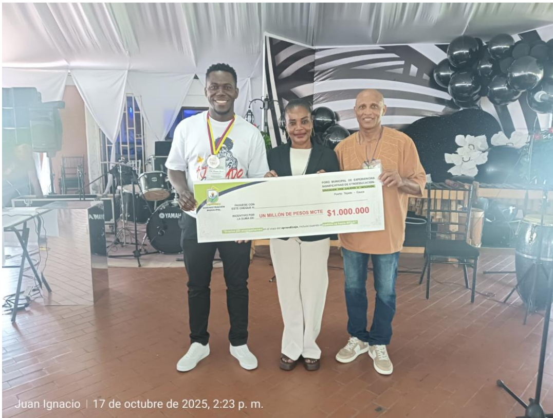
Juan Ignacio | 17 de octubre de 2025, 2:23 p. m.