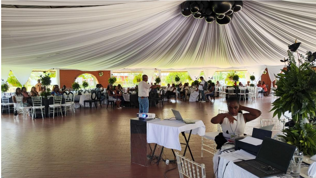
SOCIALIZACIÓN DE EXPERIENCIAS SIGNIFICATIVAS Y ENTREGA DE INCENTIVOS A LAS TRES MEJORES EXPERIENCIAS Y RECONOCIMIENTOS