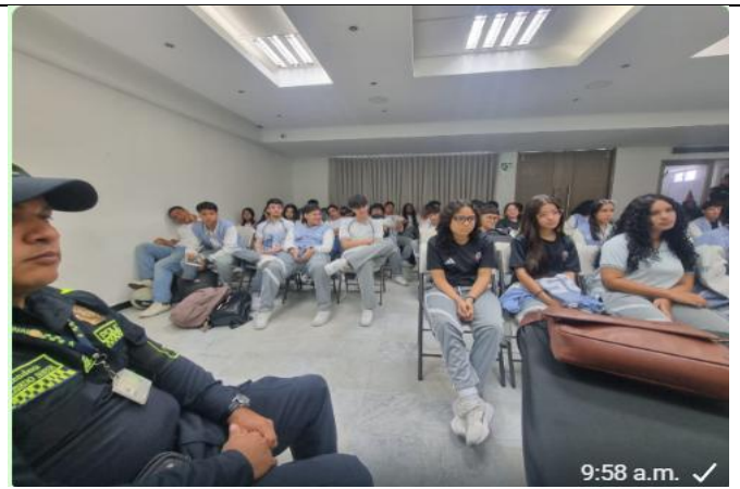
Conversatorio Liderazgo Juvenil y Participación – Colegio Inca