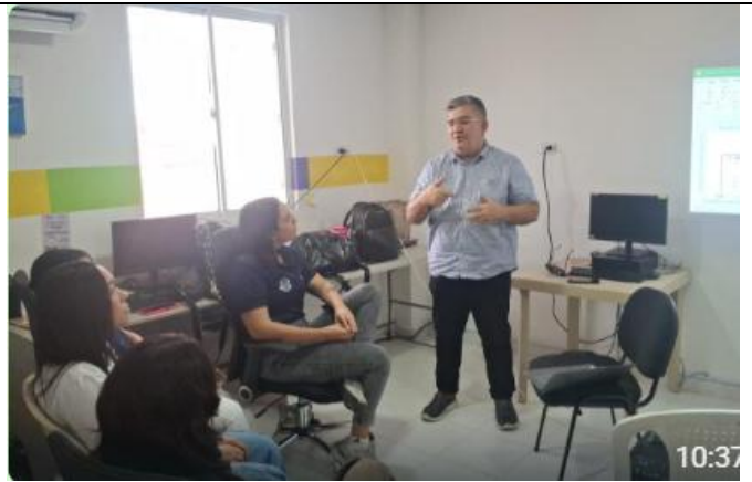
Jornada e Capacitación a Equipo de Infancia y Adolescencia sobre trabajo infantil y encuestas de caracterización