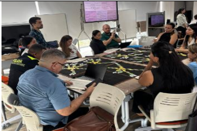
Reunión de Validación y Diseño de la Política Pública de Juventud distrital