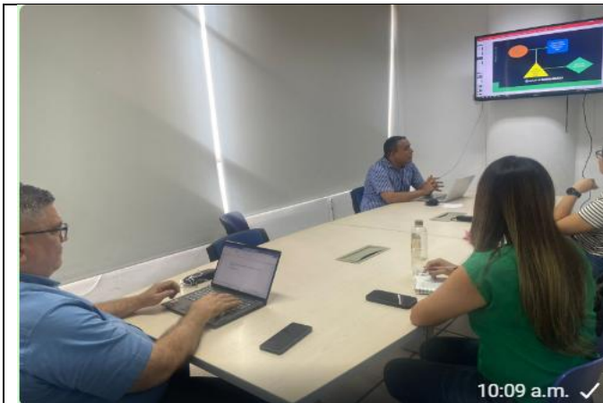
Reunión para el seguimiento de programas y políticas públicas