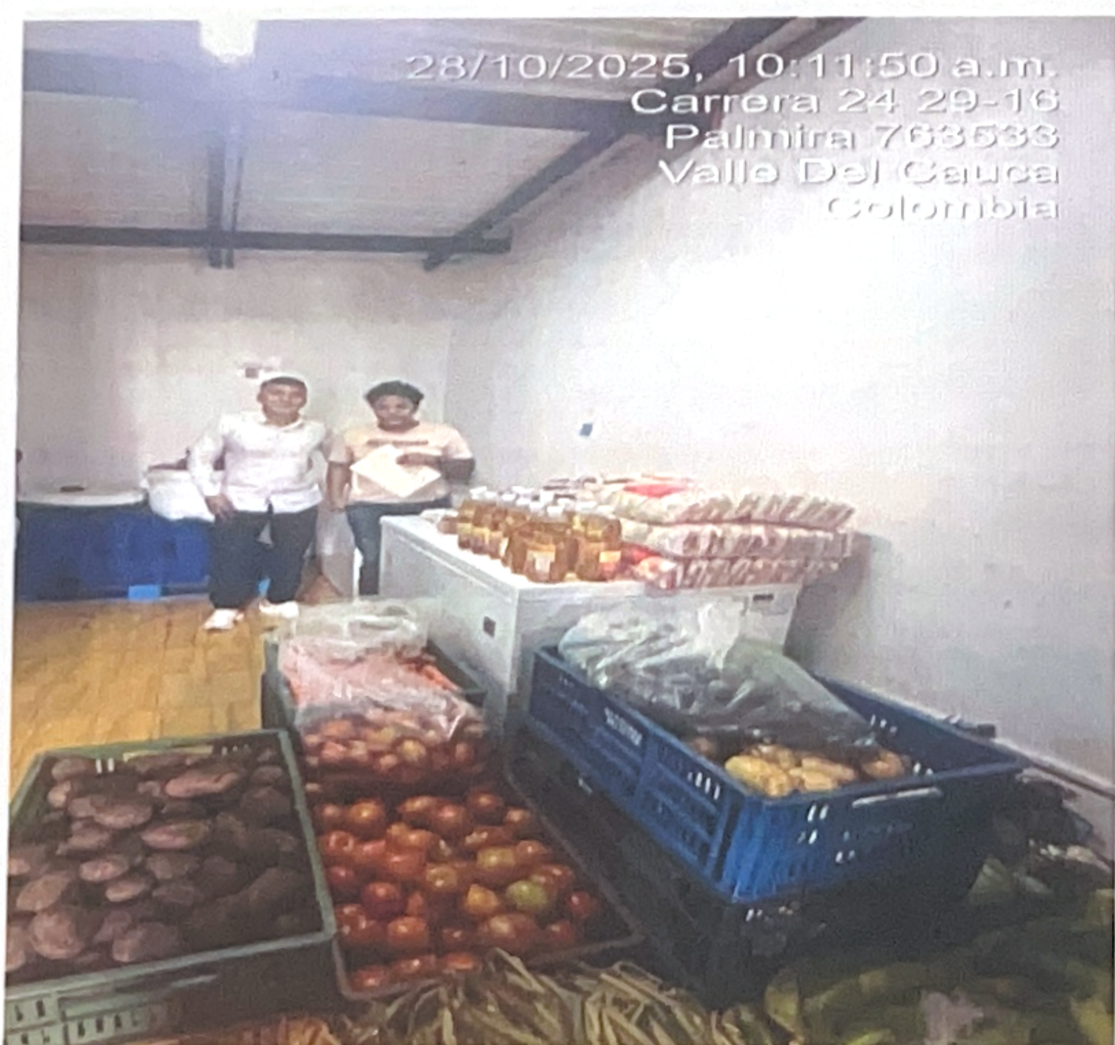
Apoyé entregando las raciones de alimentos a los comedores comunitarios en el Municipio de Palmira