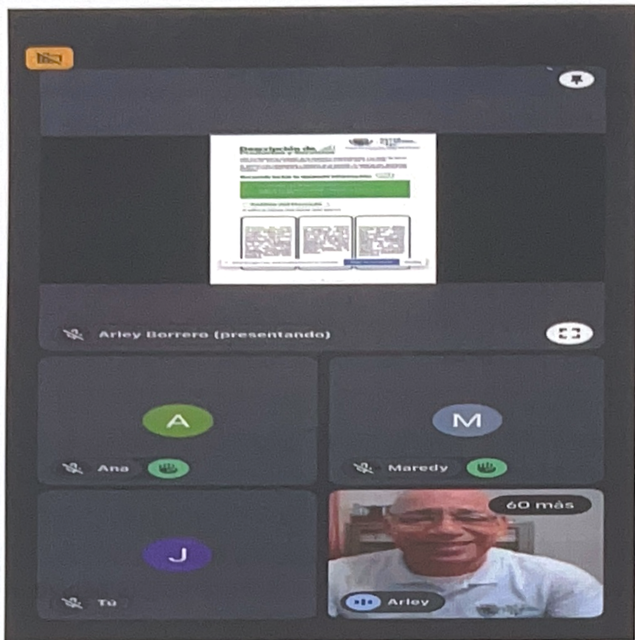
Asistí al Webinar de emociones en acción.