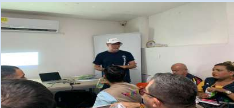
Participación en el espacio de la Red Arcoíris