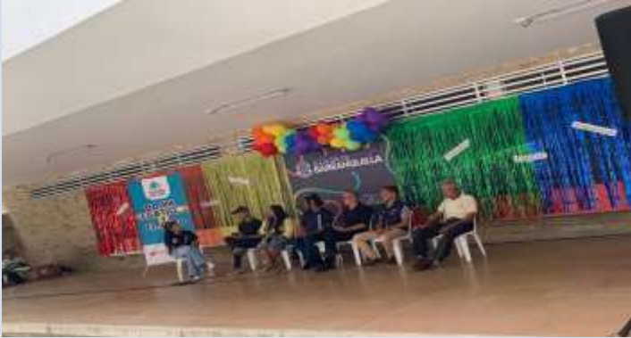
Participación en foro de empleabilidad en la feria arcoíris