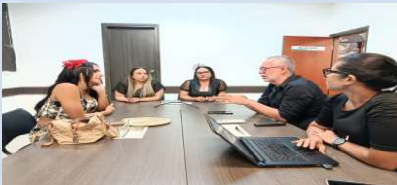
Visita de la reina del carnaval gay para articulación de agenda 2026