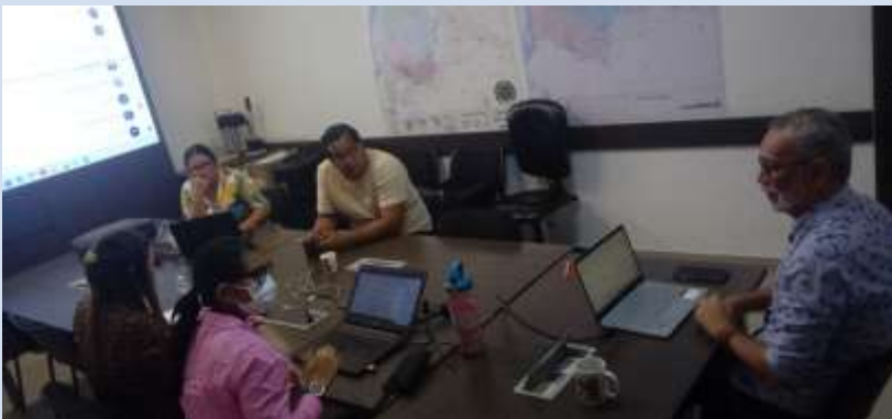
Reunión final plan de acción Secretaría de Gobierno para la Política Pública