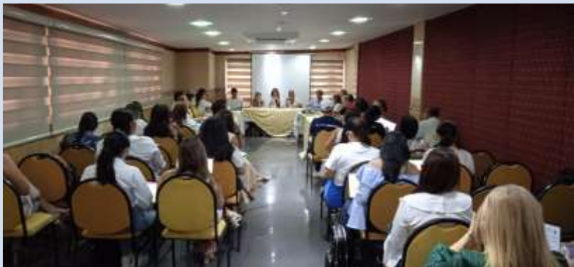
Mesa de trabajo convocada por la Procuraduría para temas de VBG