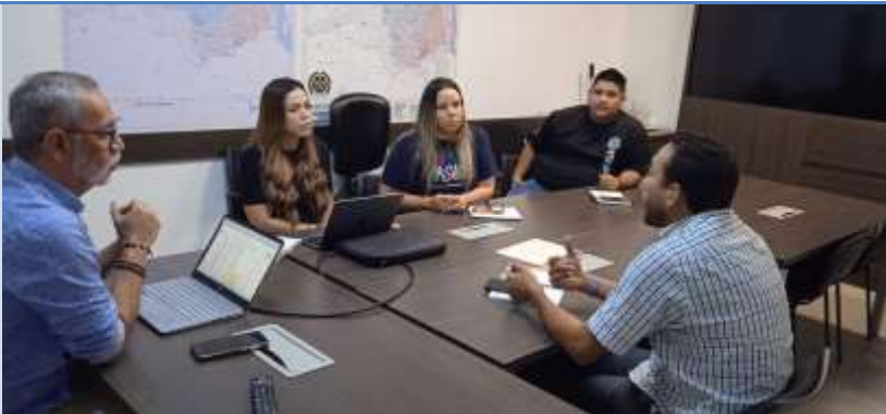
Reunión de trabajo para plan de acción política pública LGBTIQ