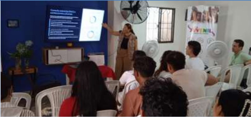
Actividad para jóvenes en Organización OAH