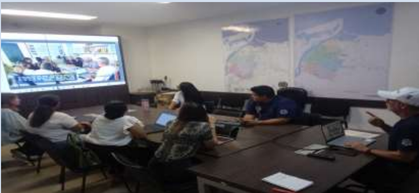
Reunión para ajustar presentación ante mesa de la procuraduría