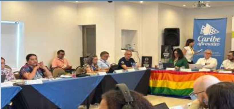
Mesa de trabajo convocada por la procuraduría general de la nación