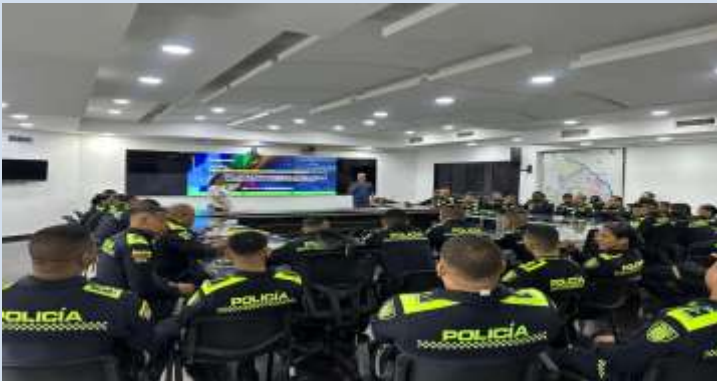
Capacitación a policías MEBAR zona área metropolitana oriental