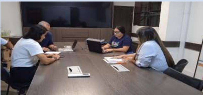
Reunión con ACOPI para ajuste propuesta