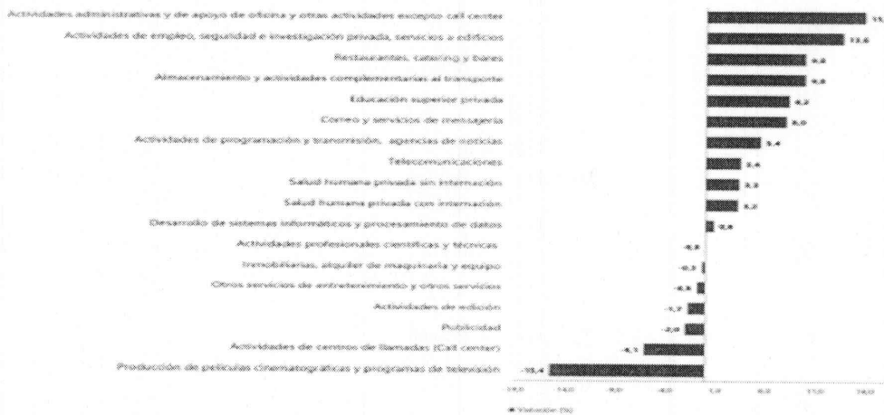
Gráfico 1. Variación anual de los ingresos nominales, según subsector de servicios Total nacional Agosto 2025 P / agosto 2024

En agosto de 2025, once de los dieciocho subsectores de servicios presentaron variación positiva en los ingresos totales, en comparación con agosto de 2024.