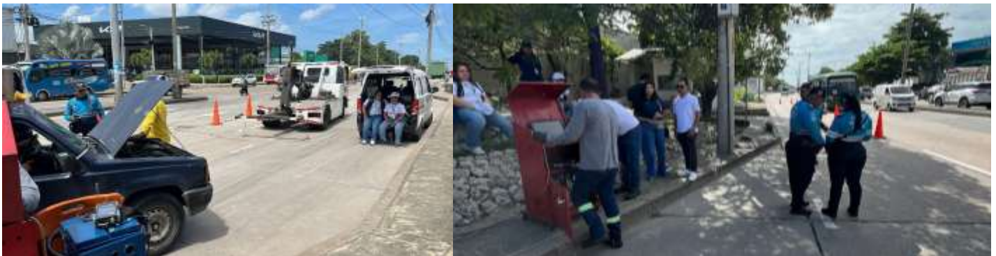
Ilustración 2. Octubre 17: Participé en la campaña que llamamos "Barranquilla con un aire a otro nivel". En esta jornada de sensibilización, conversé con conductores y otros ciudadanos, explicándoles la normativa vigente sobre el tema, mientras se realizaban los monitoreos de rutina a las fuentes móviles, es decir, a los vehículos. Básicamente, mi trabajo consistió en apoyar las acciones de vigilancia y control de la entidad, asegurándome de que la gente entendiera el porqué de estas revisiones.

Ilustración 1. Octubre 14: Se participó en la segunda sesión plenaria sobre Inclusión a nivel municipal, una iniciativa impulsada por el área social del esquema de Subsidios Económicos de la Secretaría de Administración Social. El objetivo de este encuentro es consolidar consensos, obligaciones y directrices entre las diversas entidades participantes, con el fin de ejecutar medidas articuladas que contribuyan a la consecución de las metas de los programas de Subsidios Monetarios y beneficien a las familias inscritas. Por su parte, la entidad EPA Barranquilla Verde brindará su respaldo al incorporar a promotoras destacadas en el plan de cultivos domésticos que la institución llevará a cabo.