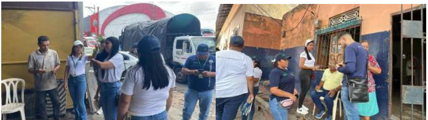
Ilustración 5. Octubre 29 . Tuve la oportunidad de sumarme al operativo de control del manejo de llantas usadas. La verdad, me pareció fundamental verificar que se estuviera cumpliendo con la resolución 1326 de 2017,

Ilustración 4. Octubre 27: Texto compartido en la reunión virtual organizada por los coordinadores del Grupo Educación Ambiental, de la cual participé, para definir las actividades que se van a realizar en el operativo de control al manejo de llantas usadas, en el sector de la Avenida Cordialidad entre las carreras 28 y 19. Desde la resolución 1326 de 2017.