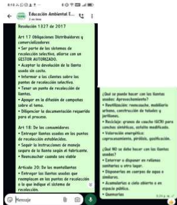
Ilustración 4. Octubre 27: Texto compartido en la reunión virtual organizada por los coordinadores del Grupo Educación Ambiental, de la cual participé, para definir las actividades que se van a realizar en el operativo de control al manejo de llantas usadas, en el sector de la Avenida Cordialidad entre las carreras 28 y 19. Desde la resolución 1326 de 2017.