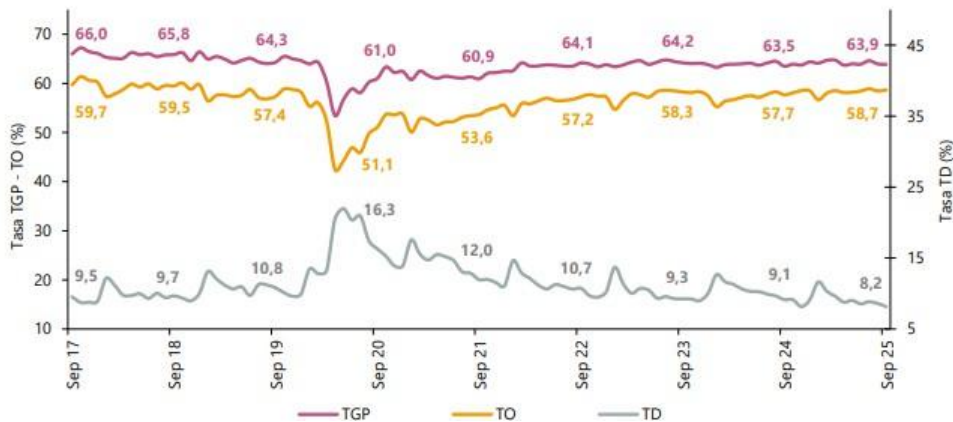
Gráfico 2. Tasa global de participación (TGP), Tasa de ocupación (TO) y Tasa de desocupación (TD) Total nacional Septiembre (2017 - 2025)

Para el mes de septiembre de 2025, la tasa de desocupación del total nacional fue 8,2%, lo que representó una disminución de 1,0 puntos porcentuales respecto al mismo mes de 2024 (9,1%). La tasa global de participación se ubicó en 63,9%, mientras que en septiembre de 2024 fue 63,5%. Finalmente, la tasa de ocupación fue 58,7%, lo que representó un aumento de 1,0 puntos porcentuales respecto al mismo mes del año anterior (57,7%).