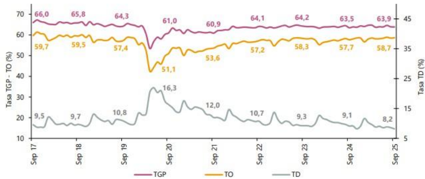
Gráfico 1. Tasa global de participación (TGP), Tasa de ocupación (TO) y Tasa de desocupación (TD) Total nacional Septiembre (2017 - 2025)