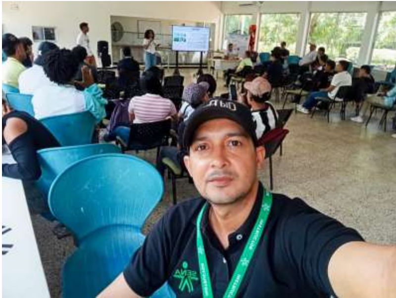
Asistencia a Ecoferia Biocaribe 2025