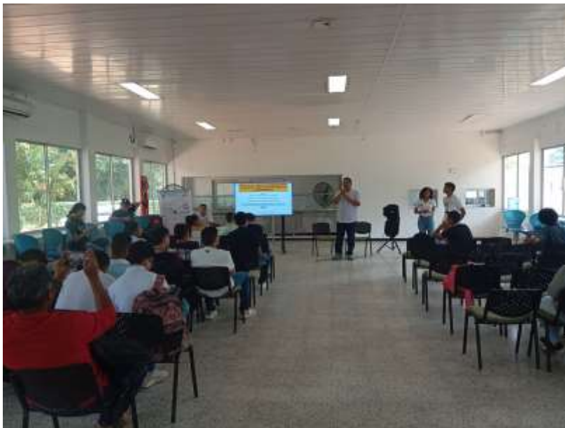
Asistencia a Línea de investigación, innovación tecnológica y sostenibilidad ambiental