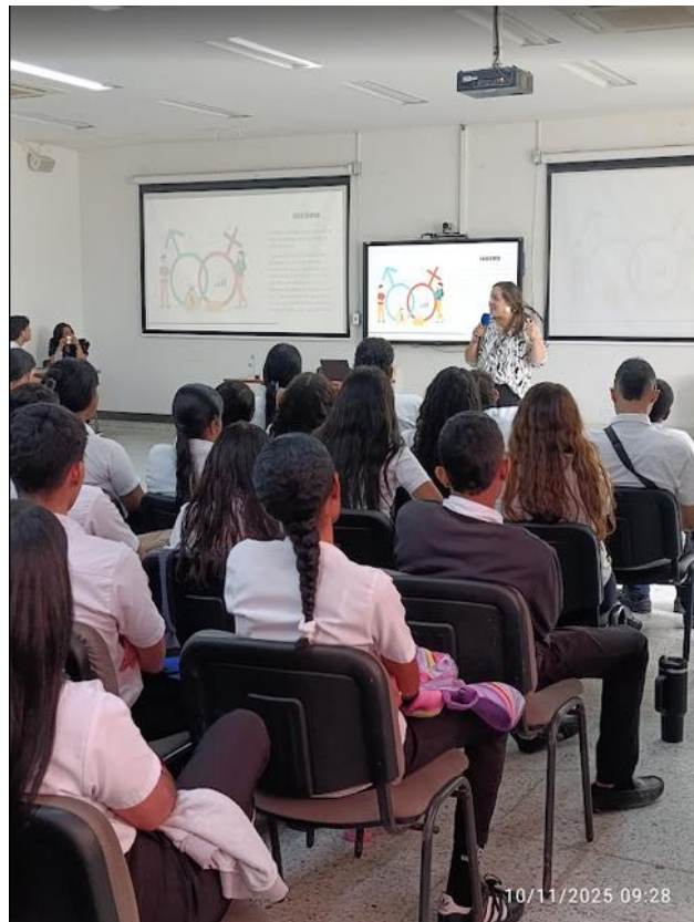
Ilustración 4: Charla prevención violencia basadas en género- 10 noviembre/ salón empresarial