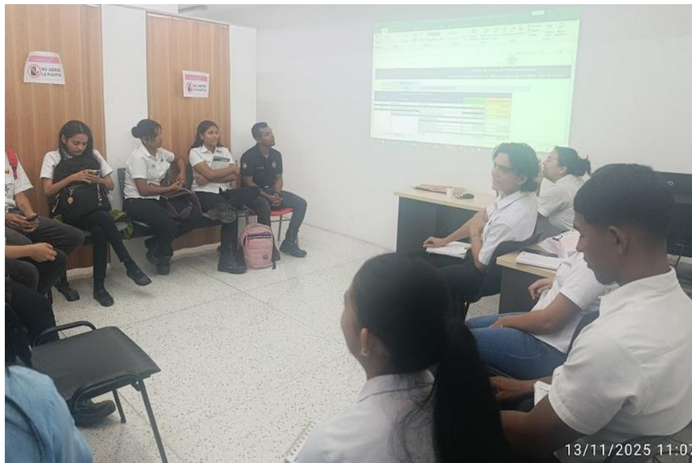
Ilustración 9: : reunión empalme Representantes y voceros enfoque diferencial y aportes a pnba 2026/ 13 noviembre/ bienestar