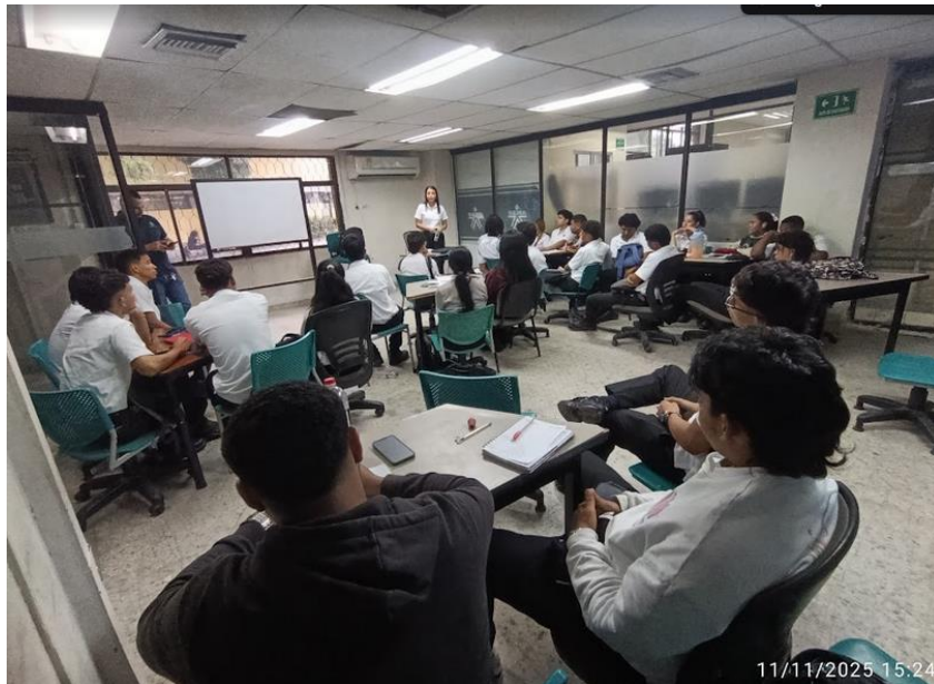
Ilustración 6: Consejería y orientación grupal- Responsabilidad. empatía/ 11 noviembre/ ambiente de formación