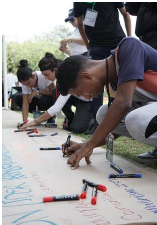
Ilustración 13: Encuentro regional de voceros / ambiente externo/ 14 noviembre del 2025