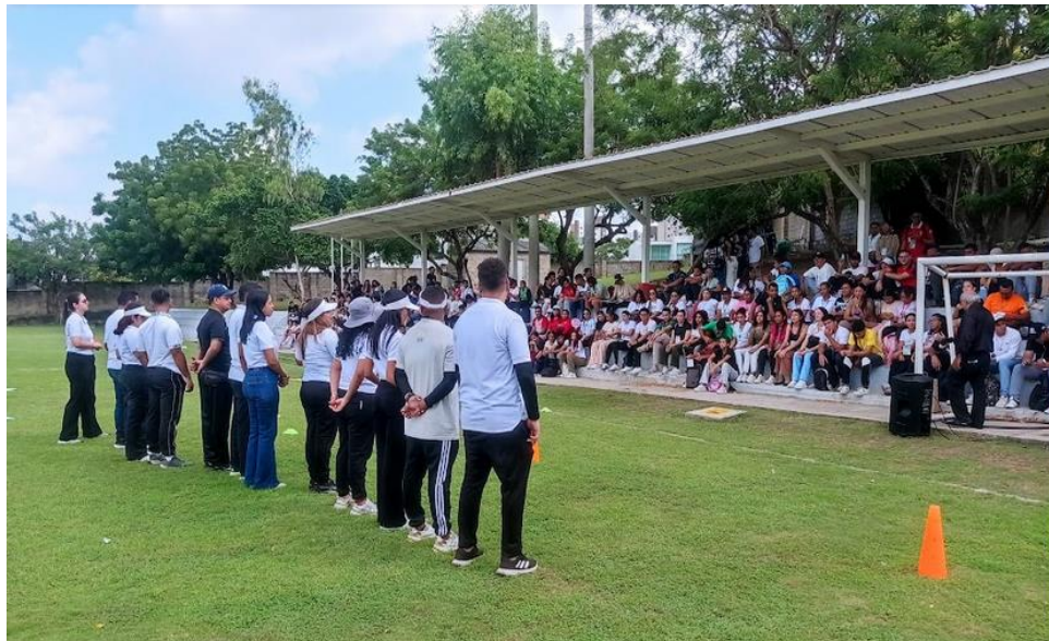
Ilustración 11: Encuentro regional de voceros / ambiente externo/ 14 noviembre del 2025