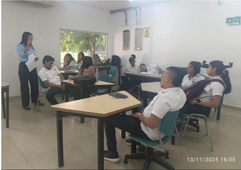
Ilustración 10: Consejería y orientación- actitud etapa productiva y taller hoja vida/ 13-11-2025/ ambiente de formación