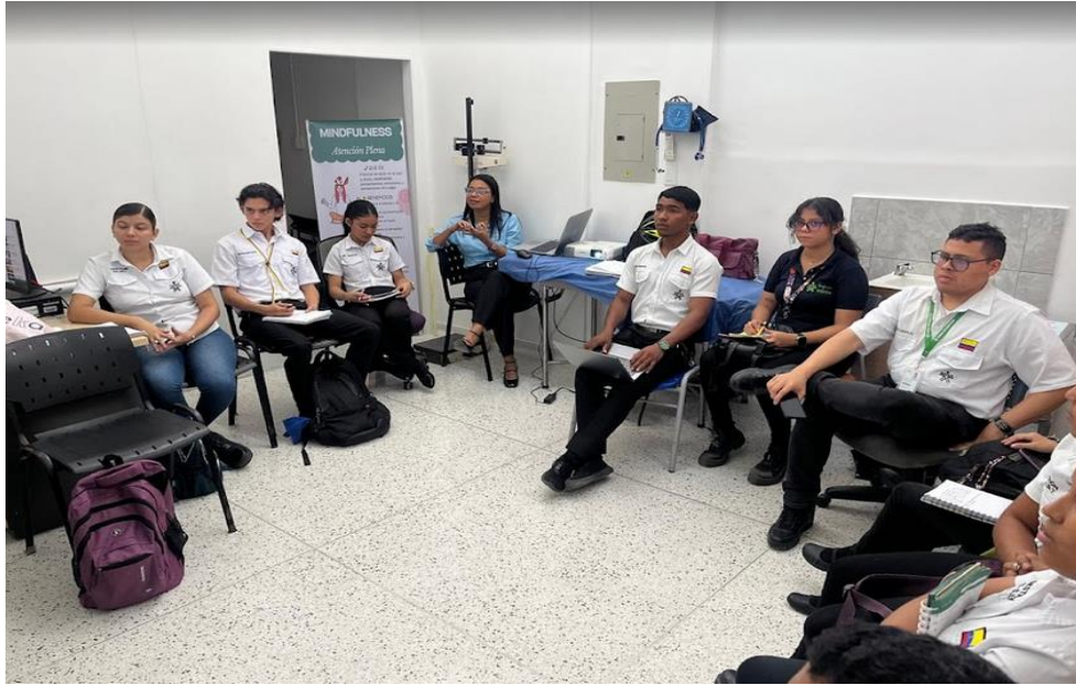
Ilustración 8: reunión empalme Representantes y voceros enfoque diferencial y aportes a pnba 2026/ 13 noviembre/ bienestar