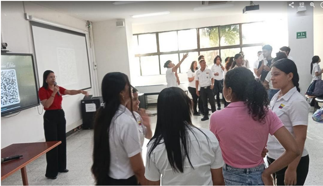
Ilustración 7: lineamientos preparación semana d enfoque diferencial- salón empresarial