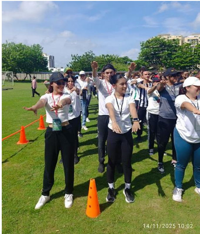
Ilustración 12: Encuentro regional de voceros / ambiente externo/ 14 noviembre del 2025