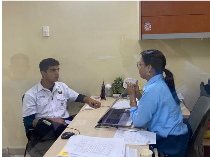
Ilustración 2: Consejería- 5 de noviembre- Problemas académicos – orientación vocacional- Ambiente bienestar