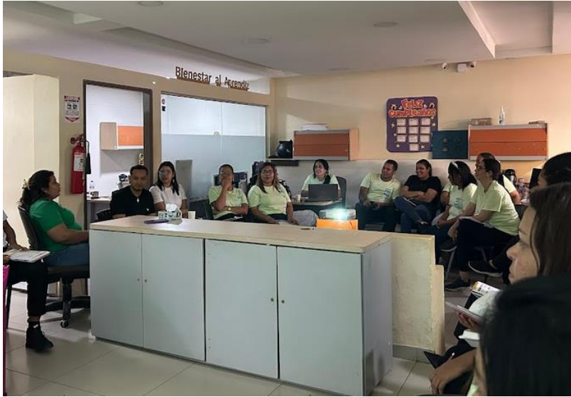
Ilustración 3: Reunión PNBA. Noviembre- diciembre/ bienestar/ 7 de noviembre