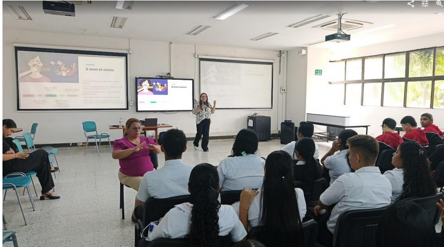
Ilustración 5: Charla prevención violencia basadas en género- 10 noviembre/ salón empresarial