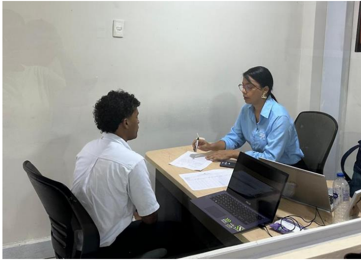
Ilustración 1: Consejería- 5 de noviembre- Dificultad salud - emoc- Ambiente bienestar