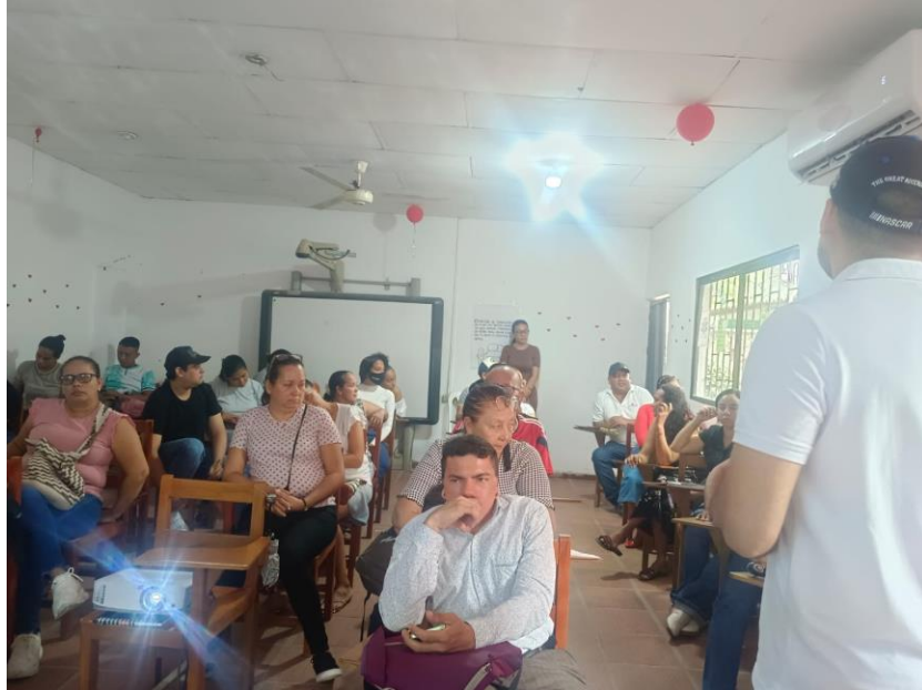
Orientación Palmar de Varela