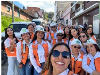
Participación en el carnaval de la creatividad