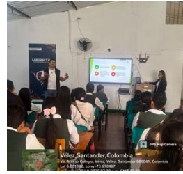
Charla informativa sobre los programas técnicos que ofrece el CGAO para articulación con el Universitario