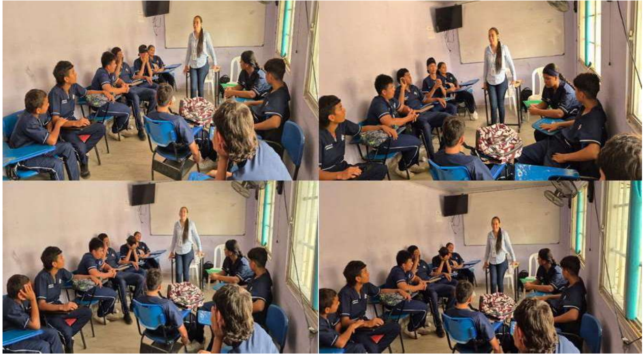
Evidencia 11. Listado e asistencia de formación

Evidencia 10. Entrega de material para formación manipulación de alimentos ficha:3348942