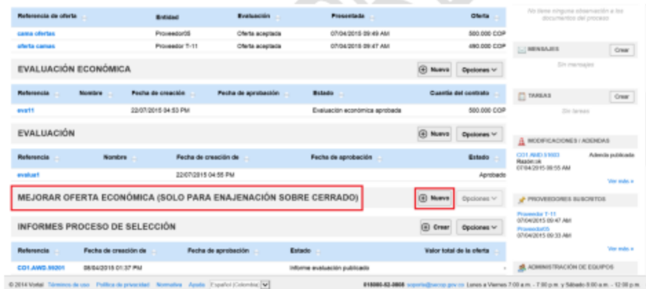
Ilustración 118. Mejorar oferta economica 1

Una vez la Entidad Estatal ha realizado la publicación de evaluación económica (Sobre 2), se habilitará el sobre para “MEJORA DE LA OFERTA ECONOMICA”