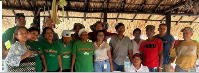
Evidencia Fotográfica en los fortalecimientos UP Favorecidas por Ruta 1 y la Formación en Mercadeo y Ventas con el Consejo Comunitario de La Concordia

Estos talleres y actividades didácticas ayudaron al logro de los resultados de aprendizaje ya que aplicaron la resolución de problemas para la identificación de ideas y la formulación de planes de negocio, los aprendices generaron habilidades y destrezas pertinentes a las competencias del programa de formación asumiendo estrategias y metodologías de autogestión.