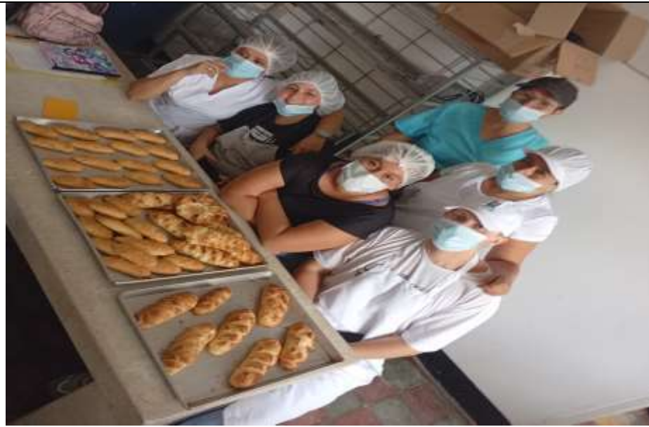
PRESENTACION DE PRODUCTO