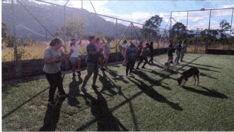
Obligación específica 5