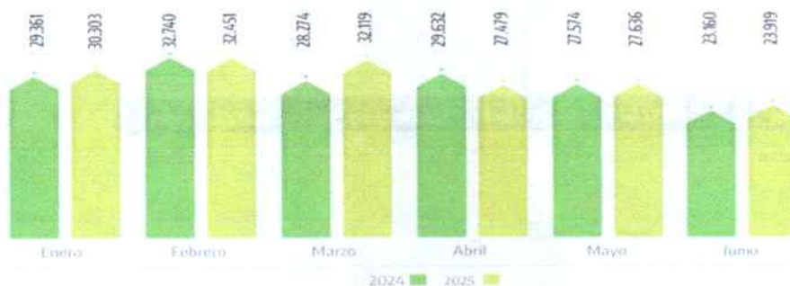
Gráfico 2. Creación de empresas por mes