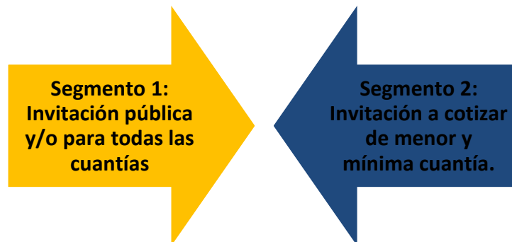
Gráfica No.2. SEGMENTOS DE PARTICIPACIÓN DEL PROCESO

En atención al análisis del sector realizado, se determinan dos segmentos de participación: