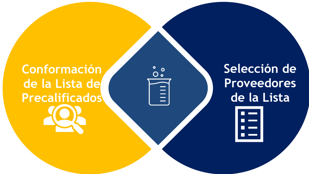
Gráfica No.1. Etapas del proceso