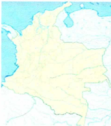
Imagen 1. Localización del municipio de Caloto en Colombia