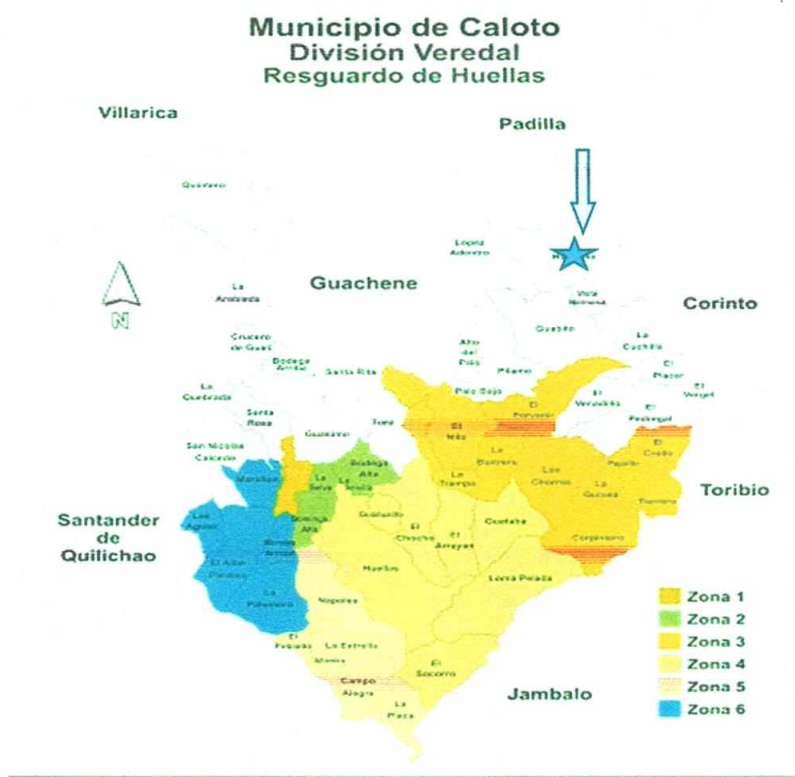
Imagen 3. Localización de la corregimiento Huasano en Caloto