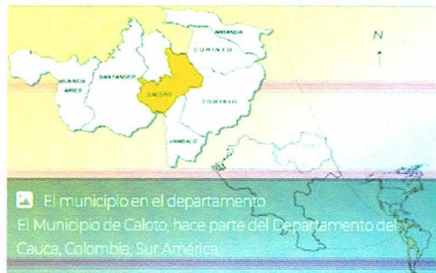
Imagen 2. Localización del municipio de Caloto en el Cauca