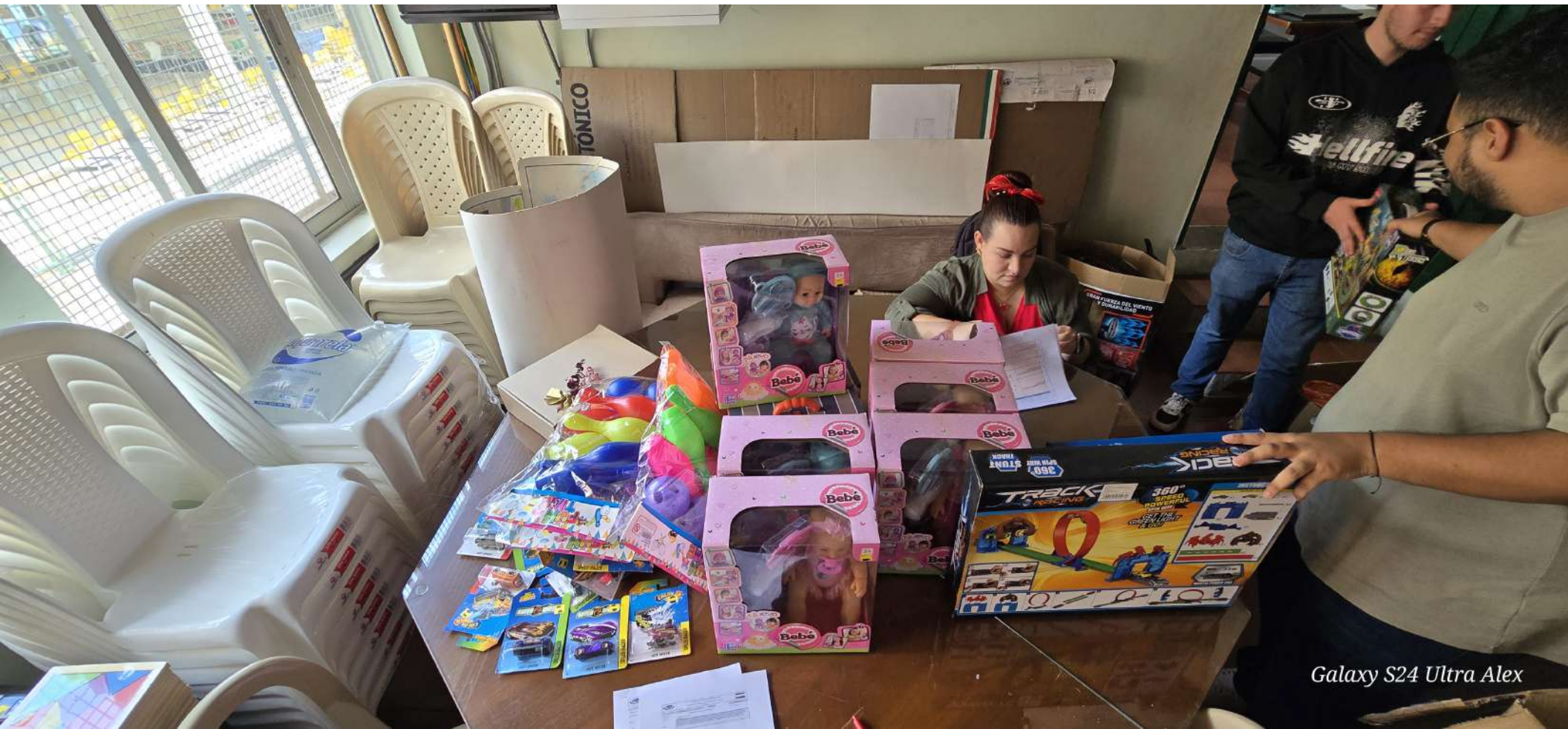
Galaxy S24 Ultra Alex