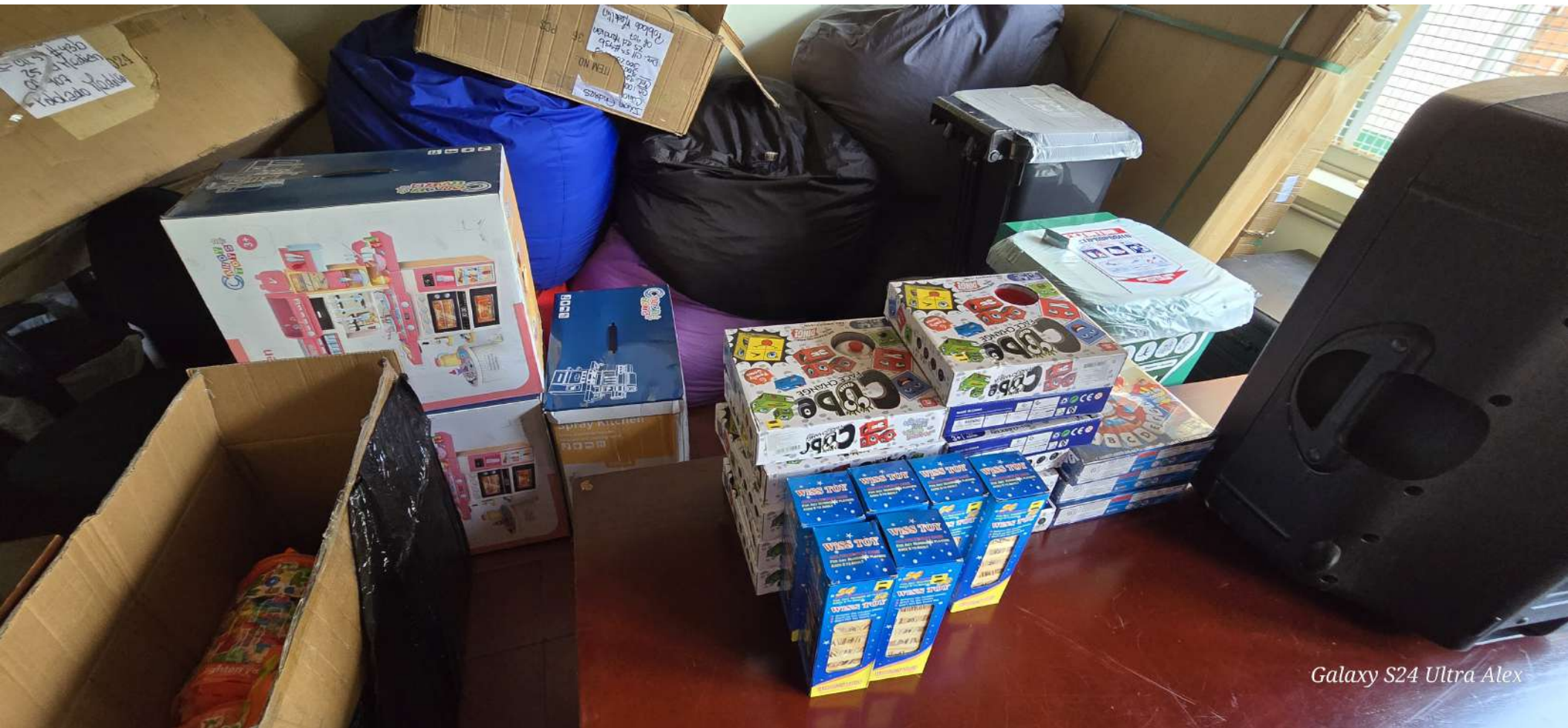
Galaxy S24 Ultra Alex