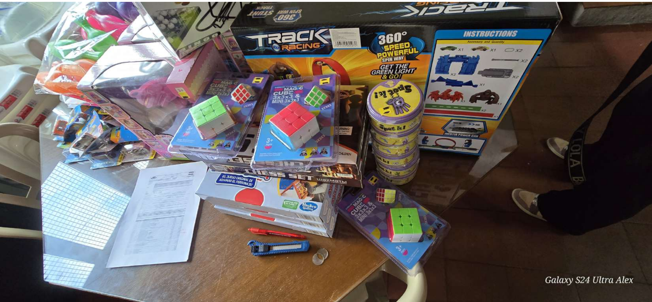
Galaxy S24 Ultra Alex