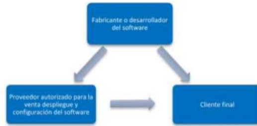
Ilustración 3 Cadena de distribución software de propósito general

Existen casos en los cuales los clientes finales integran el software dentro de una solución de múltiples componentes de TI, casos en los cuales hacen uso de un integrador como puente entre el cliente y los diferentes proveedores de servicios de TI, en este tipo de contratación el integrador se ubica en medio del cliente final y el desarrollador o distribuidor del software dentro de las cadenas de distribución previamente descritas.