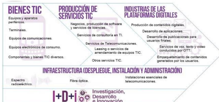
Gráfica 1 Cadena de Valor del Sector TIC

“EDUCACIÓN SUPERIOR CON CALIDAD PARA TODOS”