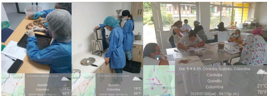
Foto 1 Evaluación sensorial del cacao ficha 3277575, Centro agroindustrial y Córdoba, Quindío

Ejecuté formación profesional integral de acuerdo con los programas de formación, apoyo a la articulación con la media, cursos complementarios y campesena en el área de cacao, higiene para la manipulación de alimentos y procesamiento de frutas y verduras