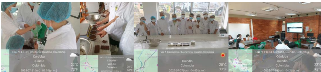
Foto 2 Talleres de formación Ficha 3146981 Córdoba, articulación grado décimo, practica de planta y socialización de etapa práctica