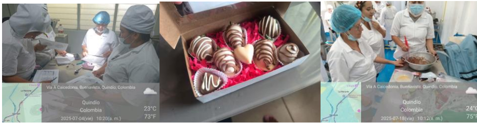
Foto 4 Formación integral en Evaluación sensorial de la calidad del cacao, ficha 3256061, Barragán, Pijao, Quindío

Utilizar adecuadamente los Elementos de Protección Personal.