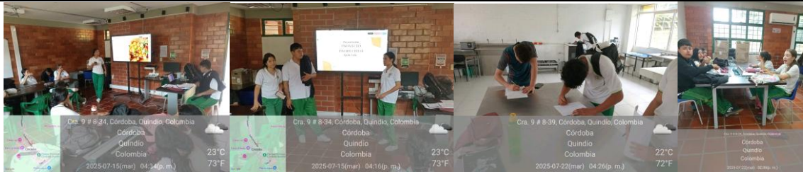
Foto 3 Talleres de Formación ficha 2910733 Córdoba, articulación grado once, y seguimiento parcial a proyectos productivos