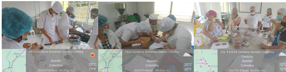
Foto 5 Elementos de protección en planta y uso de elementos de bioseguridad

Utilizar adecuadamente los Elementos de Protección Personal.