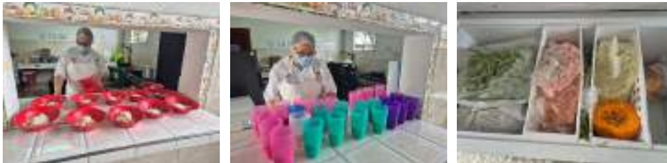
Realice seguimiento a los alimentos entregados a los estudiantes del I.E Heliodoro Villegas