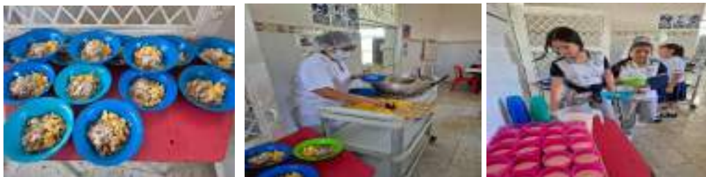
Realicé seguimiento a los alimentos entregados a los estudiantes del I.E Benilda Caicedo