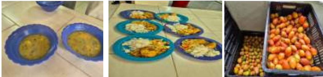
Realicé seguimiento a los alimentos entregados a los estudiantes del I.E Gran Colombia