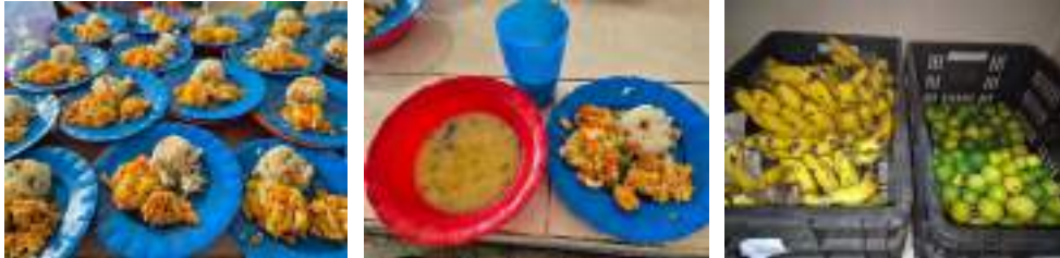
Realicé seguimiento a los alimentos entregados a los estudiantes del I.E Domingo Iruita