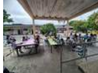
I.E Vicente E López