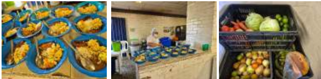
Realicé seguimiento a los alimentos entregados a los estudiantes del I.E Mater Dei