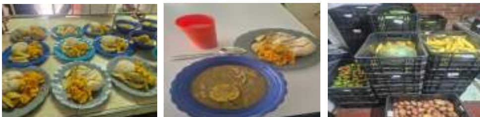
Realice seguimiento a los alimentos entregados a los estudiantes del I.E Monseñor Guillermo Becerra