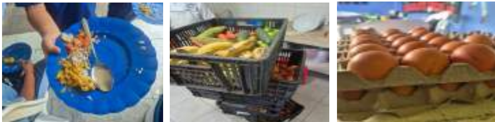
Realice seguimiento a los alimentos entregados a los estudiantes del I.E Inst Tec Del Valle